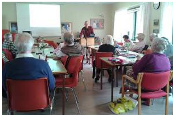
Fotos fra Seniorlejren 5.-8. maj 2014