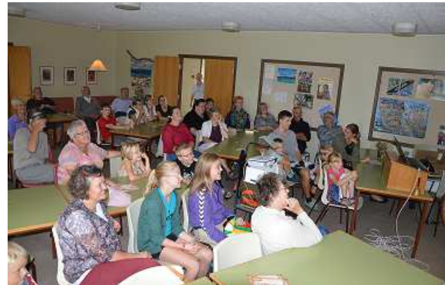
Foto nedenfor er fra sidste års VUB-lejr