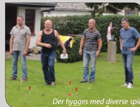
Der hygges med diverse spil