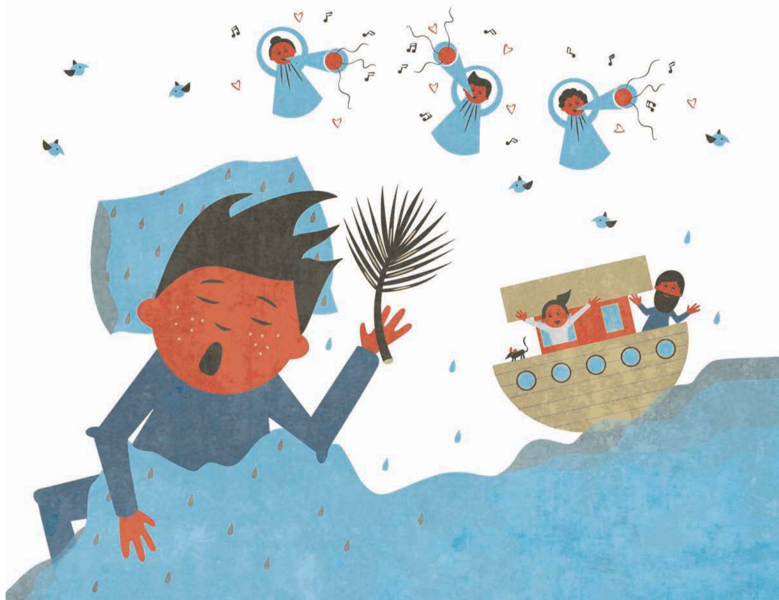
ILLUSTRATION: SARA HOLM

Det var buldermørkt i starten. Delvist inde på værelset. Delvist ude ved hyrderne på marken. Så flængedes himlen. Og med et var der en