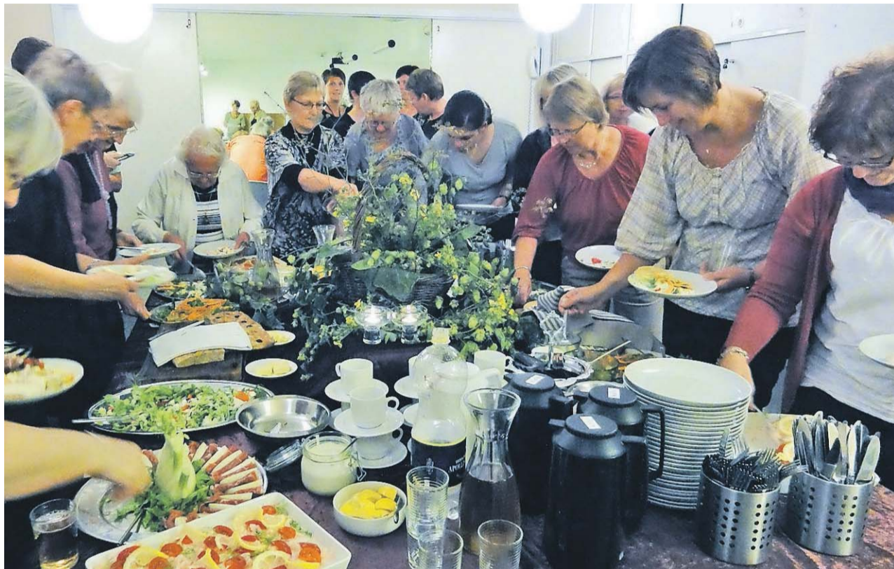
Kvindeaftenerne i Aabenraa sluttet med fadervor og en aftensang, og herefter inviterer de til et uformelt buffetarrangement, hvor der disket op med forskellige hjemmelavede lækkerier.

Efter et kvarters tid begynder mødet. Vi følger et fast koncept, så også de, der ikke er vant til et missionshusmiljø, kan føle sig trygge ved det, der skal ske.