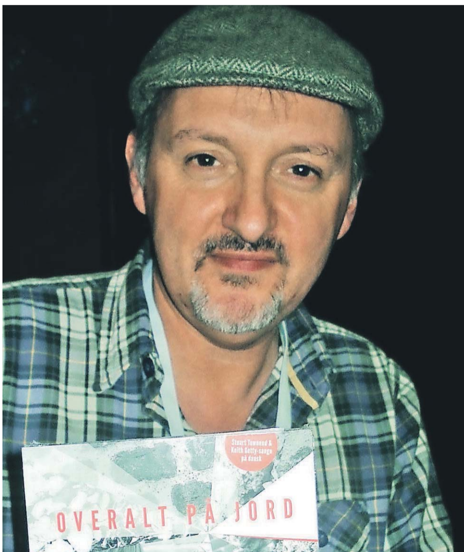
I 2011 udkom cd'en "Overalt på jord" med danske oversættelser af en række af Stuart Townends sange.