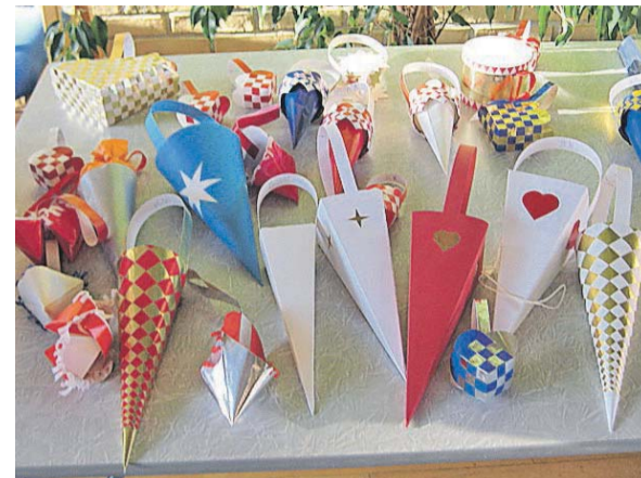
Der har været undervisning i at flette julepynt i LM i Nykøbing Falster.