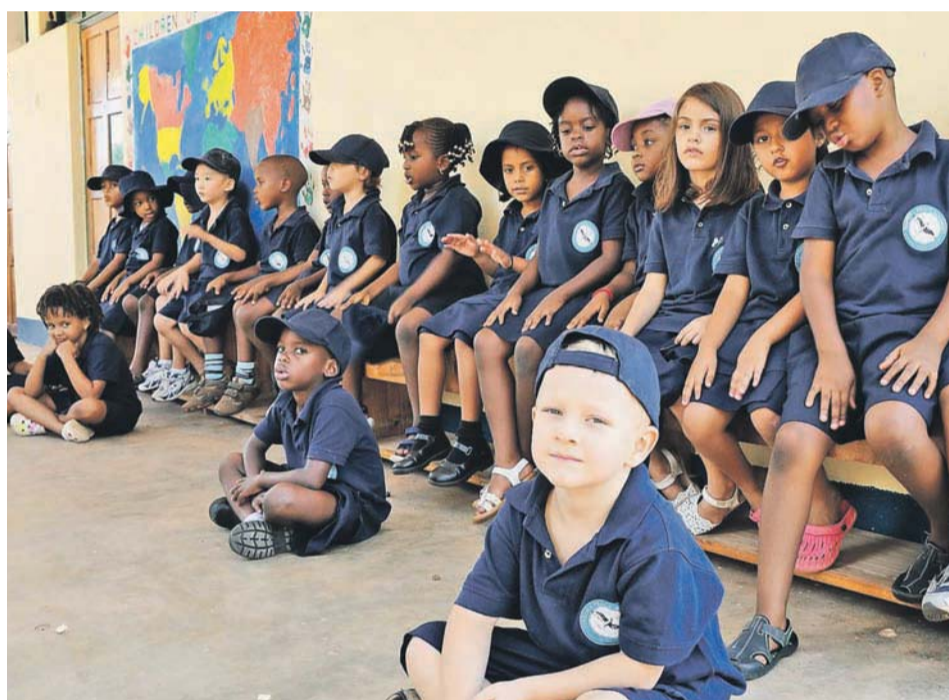
En gruppe af de yngste elever på HOPAC. Eleverne kommer fra hele verden – og halvdelen af dem er tanzaniske børn.

Og ja, så giver HOPAC's arbejde fantastisk meget mening i sig selv. Det giver mulighed for, at andre mis-