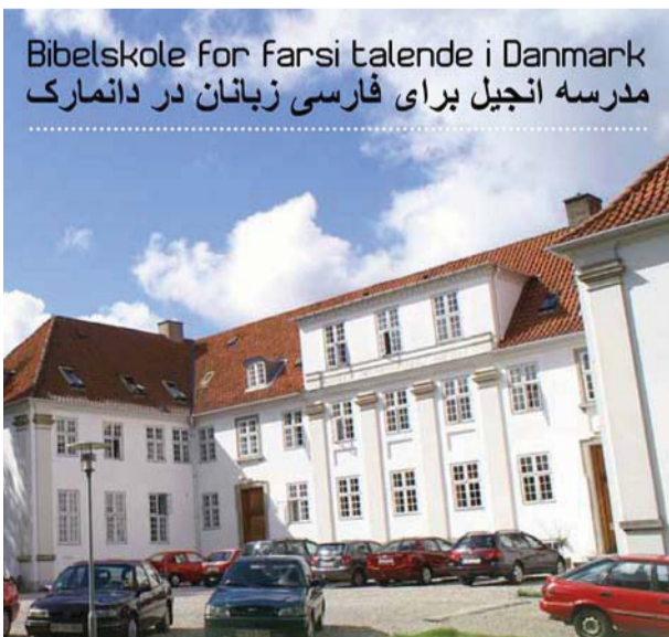
Bibelskole for Farsi talende i Danmark مدرسه انجیل برای فارسی زبانان در دانمارک

Til efteråret er det muligt at få tolket undervisning til farsi