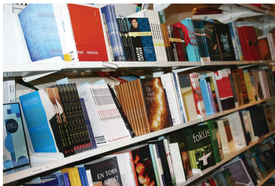
Det vigtigste er, at bøgerne bliver læst, mener LM's to medlemmer af redaktionsudvalget.

"At folk kommer til at læse gode bøger. De skal ikke stå på vores reoler som trofæer. Vi skal ikke udgive bøger for at udgive dem, men de skal være bibelsk og menneske-