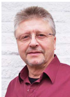
Evangelisk Alliance. Han beklager den forvirring og usikkerhed, som invitationen af Manu Sareen har skabt.