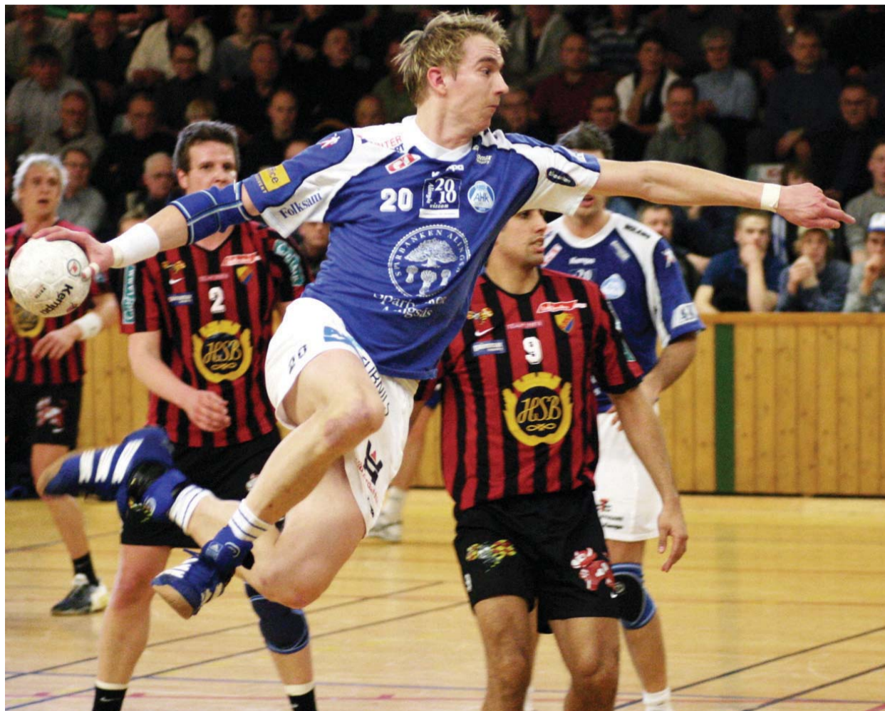
Som kristne har vi brug for hinanden, ligesom alle spillerne på et håndboldhold har brug for hinanden.

Ansgarvej 2 - 3400 Hillerød - Tlf. 4826 0766 - lmh@lmh.dk - www.lmh.dk