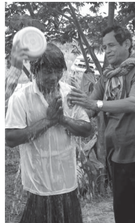
I Fjendeskoven er mange blevet omvendt og døbt.

Den erkendelse af sandheden tager de så med hjem til dem, der ikke gav dem Jesus >