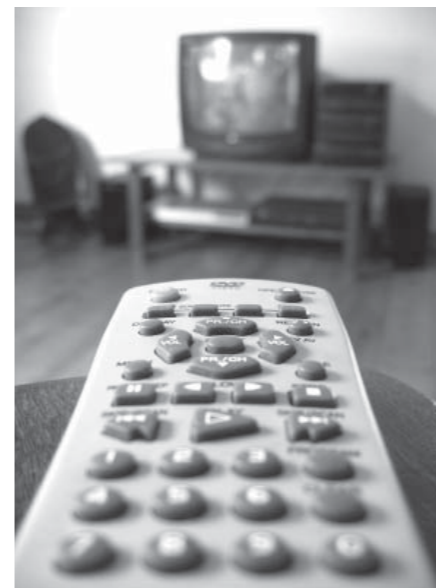
Hvad bestemmer retningen for dit liv? Er det reelt karrieren, fjernsynet, fornøjelser og lædermøbler?

Cand.theol. 1996, ph.d. 2009 Lærer på Dansk Bibel-Institut og bibelunderviser i LM