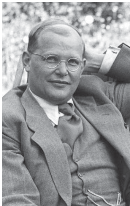
Dietrich Bonhoeffer, 1939.

ken betydning Kristus egentlig har for os i dag, så skal Bonhoeffers dramatiske liv kort skildres. 2