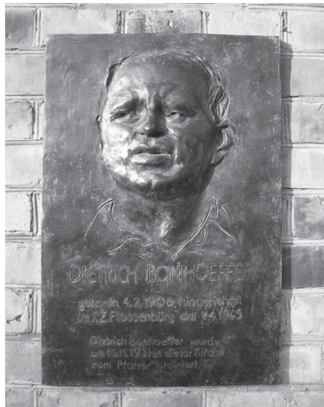
Mindesmærker for Dietrich Bonhoeffer i Wrocław i Polen og ved St. Matthäikirche i Berlin.

råde. 23 Den liberale teologi blev kritiseret af Bonhoeffer, netop fordi den tillod verden at anvise Kristus hans plads i denne verden. I konflikten mellem kirken og verden accepterede den liberale teologi, at verden havde givet definitionen af, hvad fred er. 24