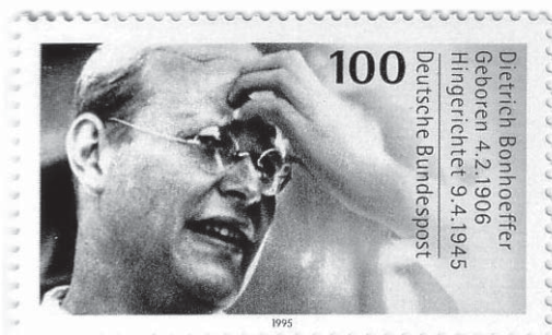
Dietrich Bonhoeffer på et tysk frimærke fra 1995

ligiøse menneske har forestillet sig. Gud er skjult. I Kristi kors møder vi noget helt andet, end hvad det religiøse menneske havde forventet. Vi er kommet frem til spørgsmålet om, hvordan tanken om "den myndige verden" hænger sammen med korsteologien. Bonhoeffer skriver i et af sine fængselsbreve: