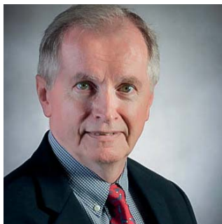
D. A. Carson, f. 1946 Professor i NT ved Trinity Evangelical Divinity School i Illinois, USA Medstifter af The Gospel Coalition

Jeg har en præsteven, som plejer at bede sine praktikanter om at fortælle, hvad evangeliet er med ét ord, derefter én sætning, ét afsnit og til sidst én side, så de begynder at se, hvordan tingene hænger sammen. Lad mig forsøge noget lignende.