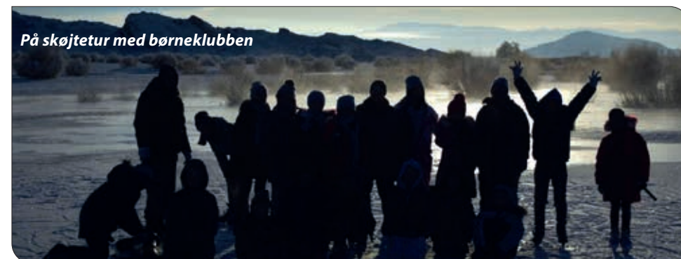
På skøjtetur med børneklubben