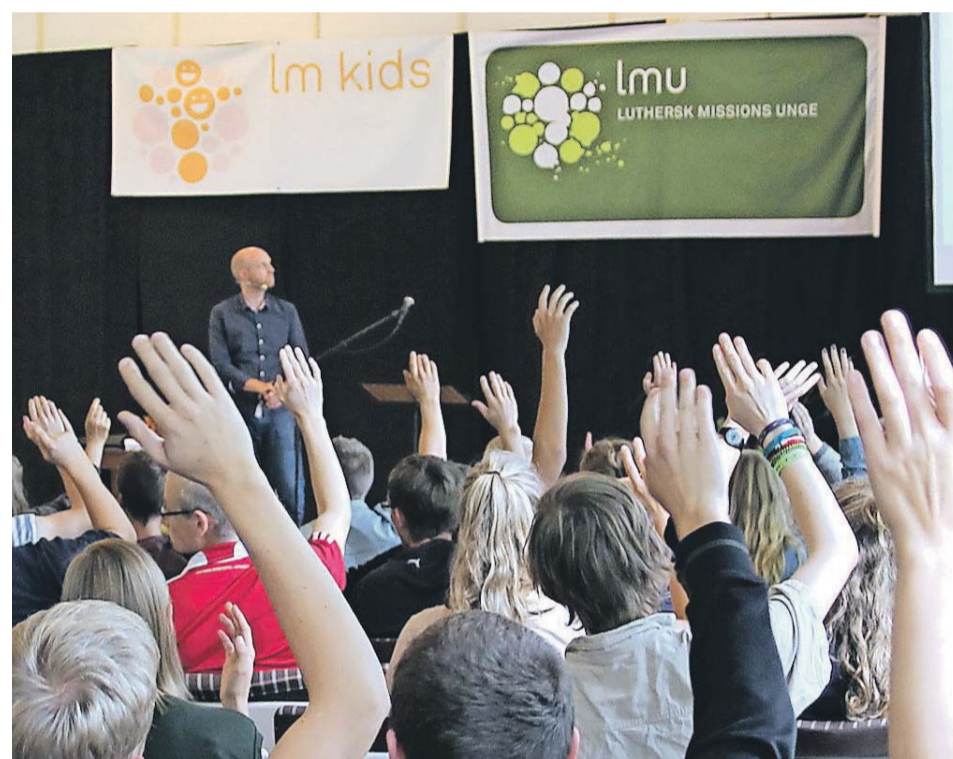
Fra en af afstemningerne ved generalforsamlingen på LMBU's lederkursus i 2013.