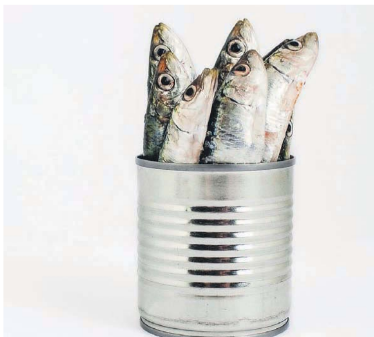
Hvis der ikke er plads til for eksempel sandhed, forskellighed og hvile i et fællesskab, så bliver det for trangt og skaber mistrivsel.

De kristne fællesskaber fungerer heller ikke, når der bliver for trangt! brs