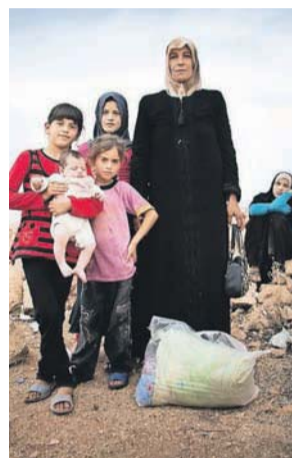
Mange syrere og irakere må flygte, fordi de bliver forfulgt af terrorister fra IS.

"Frygt ikke dem, der slår legemet ihjel, men ikke kan