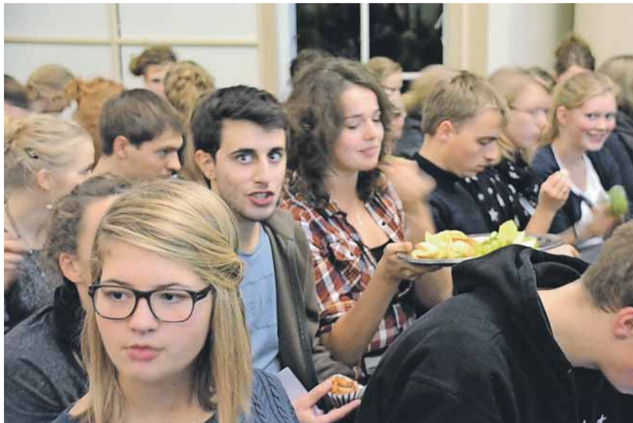
"Hvad mætter menneskers indre sult?" Det spørgsmål lød – og blev besvaret – på Mission14. Temaet var Just Eat , og ud over den åndelige mad var der også masser af god mad til maven.

"Livet er som vand i en hullet spand," citerede han Platon med det formål at pointere, at lige meget hvor meget vi fylder vores liv