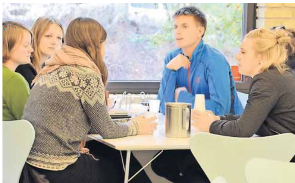
Deltagerne på Mission14 havde mulighed for at "fordøje" bibeltimerne ved at bearbejde dem i samtaler og refleksion i små grupper.

"Lad ilden, der er blevet tændt på Mission14 sprede sig, så de kan mærke varmen i Brønderslev, Brøndby, Arequipa og Arusha. Må vi få smag på Jesus, så han bliver vores sjæl umistelig. Må vores medmennesker blive lige så umistelige for os, som de er for Jesus. Lad dem smage på Himlen."