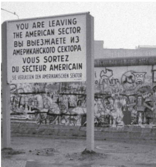
Berlinmuren blev opført tværs gennem Berlin i begyndelsen af 1960'erne og delte byen i to indtil 1989.

Ingen kan i dag med en politisk vinkel forklare mu-