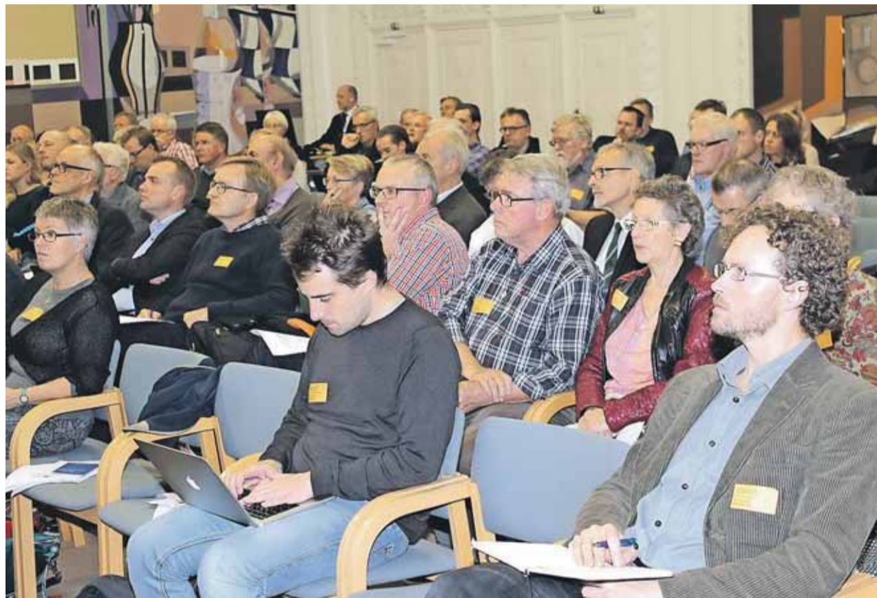
Knap 100 mennesker var mødt op til høringen på Christiansborg om religionsfrihed og kristendomsfølgelse.

"De fleste kristne i Mellemøsten ønsker ikke at blive set som en minoritet, Vesten har en speciel interesse for. Det gør dem endnu mere sårbare. Mange hader