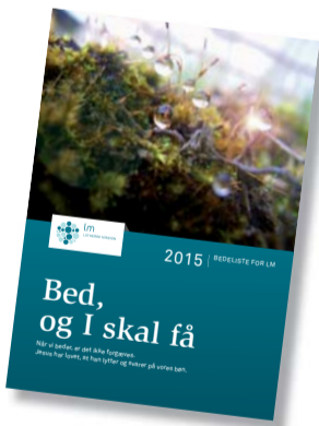
Bedehæftet for 2015 er vedlagt dette nummer af Tro & Mission .

dagsting eller mennesker, hvor der er brug for forbøn. Det kan være en lejr i weekenden eller en i skolen, der har slået sig.