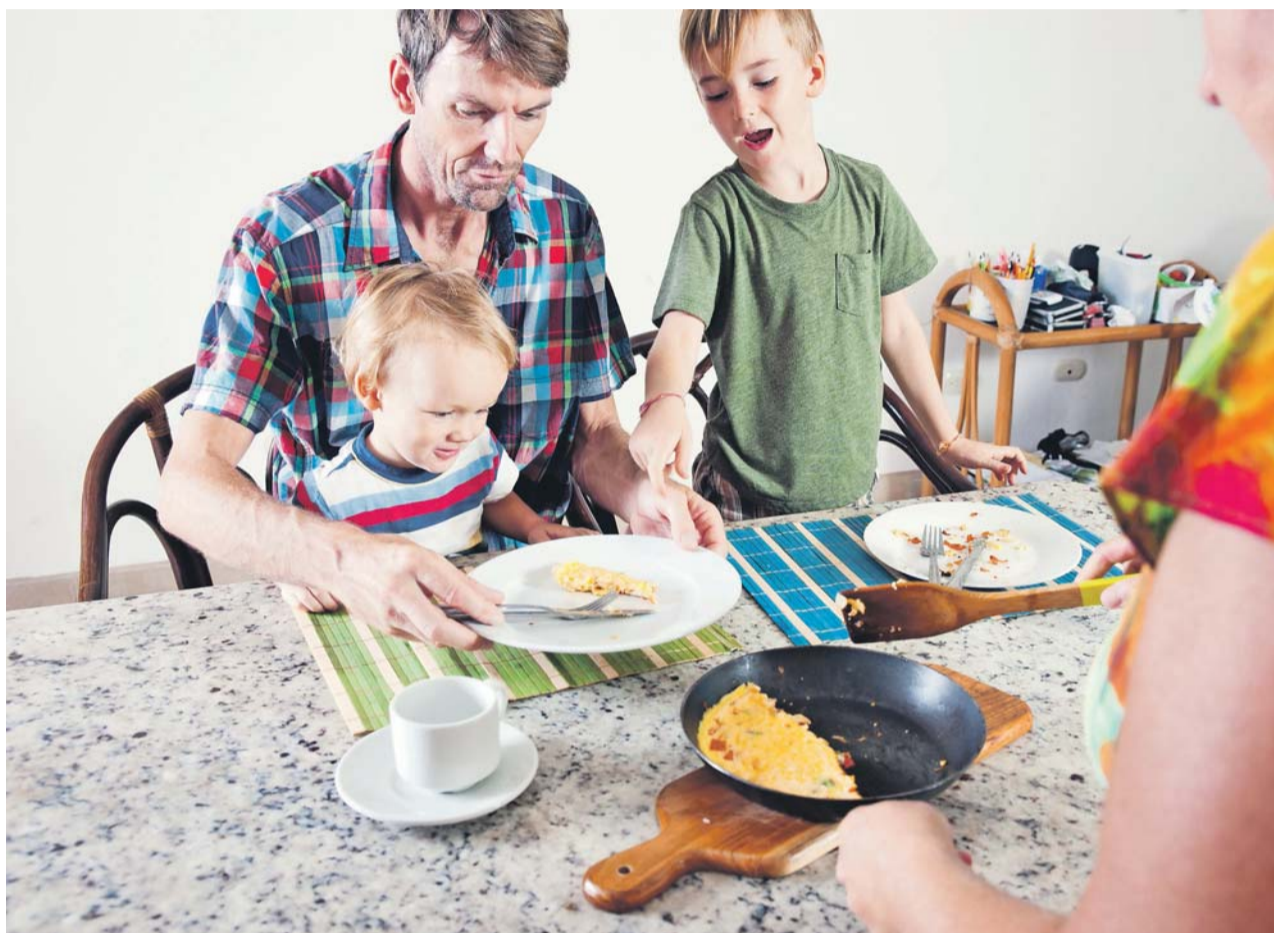
Når vi lever tæt sammen med ægtefælle og børn, tvinges vi til at tjene – og tage hensyn til – hinanden. Men vi får også foræret en masse kærlighed og tryghed.

Fællesskabet mellem mor og far er fundament, kerne og motor i kernefamilien. Sammenlignes kernefamilien med et tempel, er kærligheden og samspillet mel-