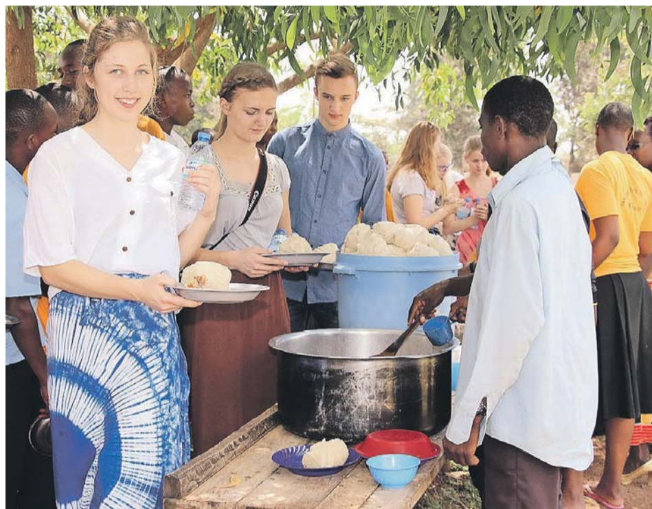
Eleverne fra Løgumkloster Efterskole var flere gange sammen med jævnaldrende tanzaniske unge.

Dette program punkt havde været årsag til en smule