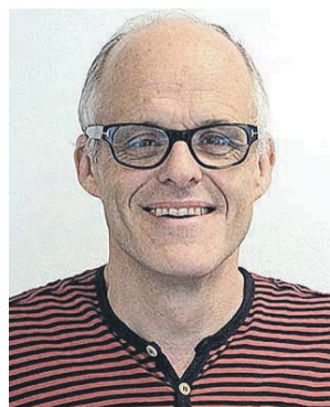
Med legatet vil LM gerne signalere opbakning.