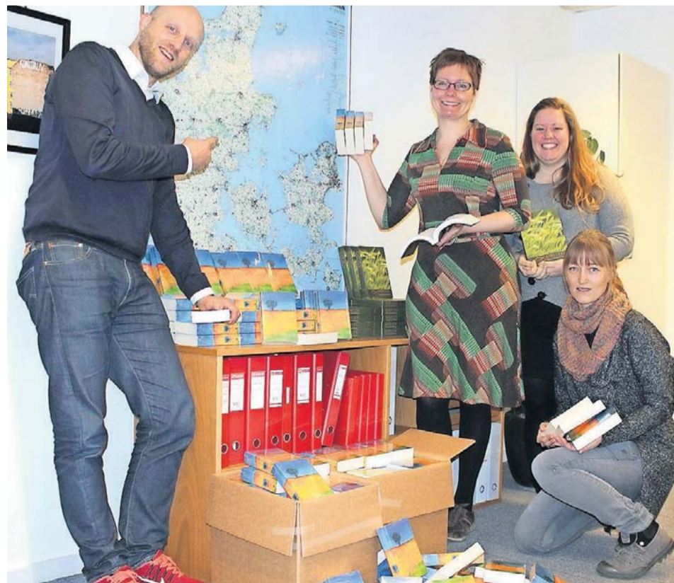
LMU-konsulenterne er klar med bibler og Ny Testamenter til uddeling i hele Danmark.

• en pulje til at betale for fire nydanskere på LMH.