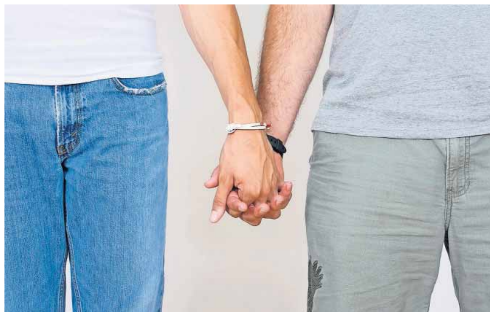
Amerikanske præster kan allerede i dag selv afgøre, om de vil vie homoseksuelle i de stater, hvor ægteskab mellem to af samme køn er tilladt ved lov.

terianske kirke har omkring 1,8 millioner medlemmer og 4.000 præster og tæller blandt andet et netværk, der arbejder for vielse af homoseksuelle.