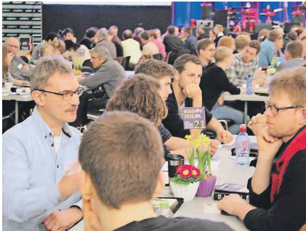
De 500 deltagere sad i grupper ved borde – opdelt efter, hvilke arbejdsgrupper man er engageret i. Ved alle samlinger var der oplæg til samtale og bøn ved bordene.

storskærmen. Et kort, hvor der var tegnet hvide plamager de steder, hvor de fire organisationer står svage, og de fire ledere konstaterede, at Danmark bliver mere og mere hvidt.