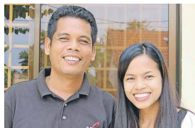
Somalena og hendes mand gør en stor indsats med evangelisation i Fjendeskoven i Cambodja.

Arbejdsgivere er ikke meget for at give så mange fridage. Så antallet ligger på omkring 30, og en del af disse ignoreres uden for det