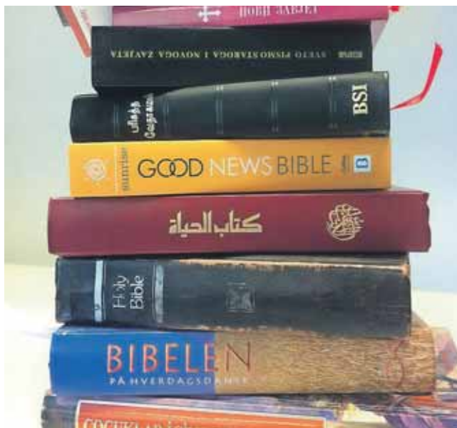
Gennem hjemmesiden biblebooks.dk kan man købe bibler og anden litteratur på mange sprog.