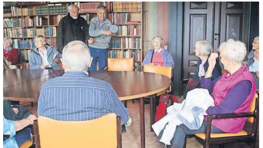
Hygge i dagligstuen på seniorlejr på Sildestruplejren på Falster.

Vi er en lille afdeling her på Lolland-Falster, og vi har ikke mandskab til at afholde mere end en lejr om året, men vi har altid plads til en (to, tre fire, mange) til.