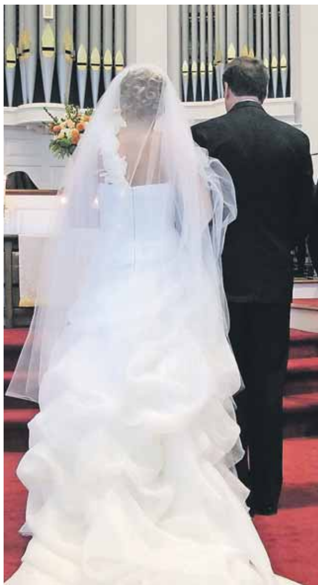
Formanden i LM-kirken i Herning mener, at det er rigtigt at tage hele vielseshandlingen ind i missionshuset.

Præster i et godkendt trossamfund kan også nægte at vidne i retten, hvis sagen handler om emner, som præsten har fået kendskab til gennem sit embede. Hvis man er i fængsel, har man også ret til at få besøg af