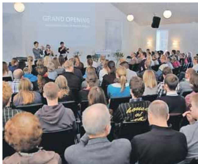
Aroskirken er fælles med LM-kredsen i Aarhus om LM-huset i byen. Huset blev indviet i 2010.

Manglende godkendelse som trossamfund får formentlig ikke konsekvens for dagligdagen lokalt