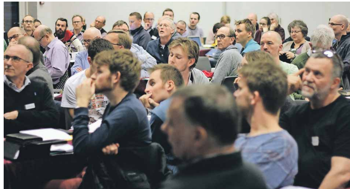
Forkyndere kan også lytte, og der blev lyttet intenst til undervisningen på Forkynderkonferencen.