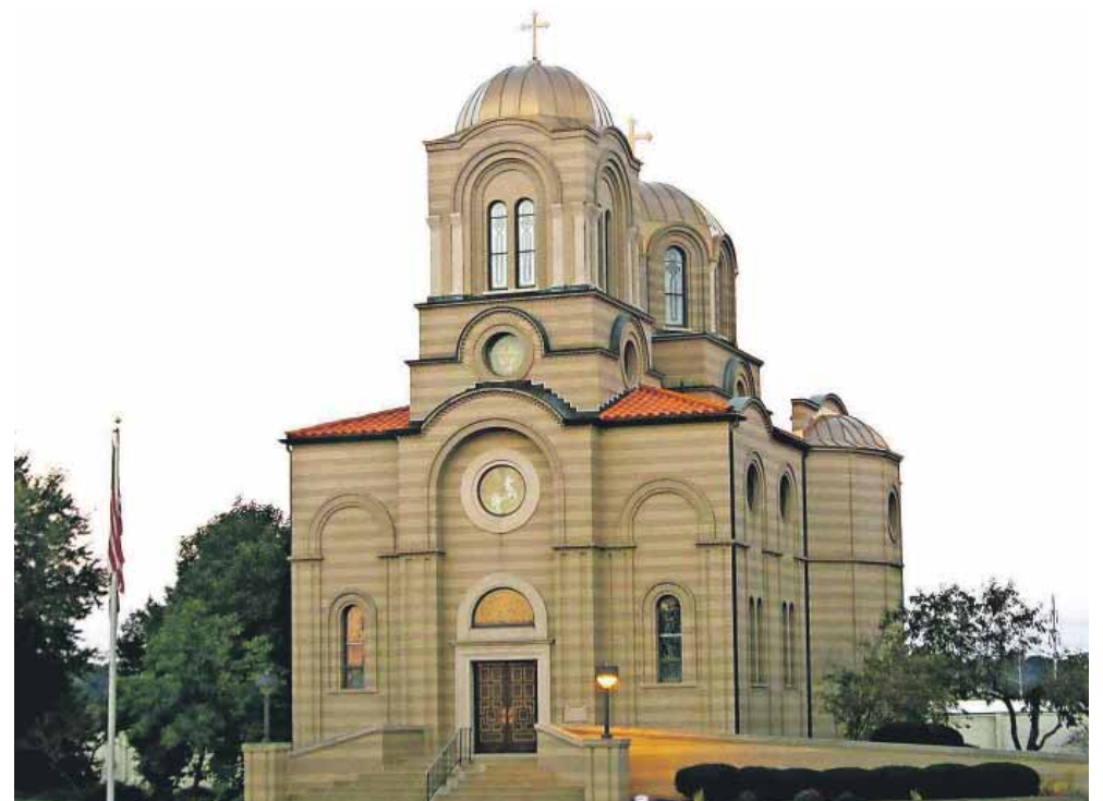
Syrisk ortodoks kirke.

De nye er muslimer, der dukker op i kirken og fortæller, at de vil være kristne. DEM's samarbejdspartnere fortæller, at de tidligere muslimer skal komme i kirken i flere måneder og modtage dåbsundervisning, før de kan blive døbt. Dette sker