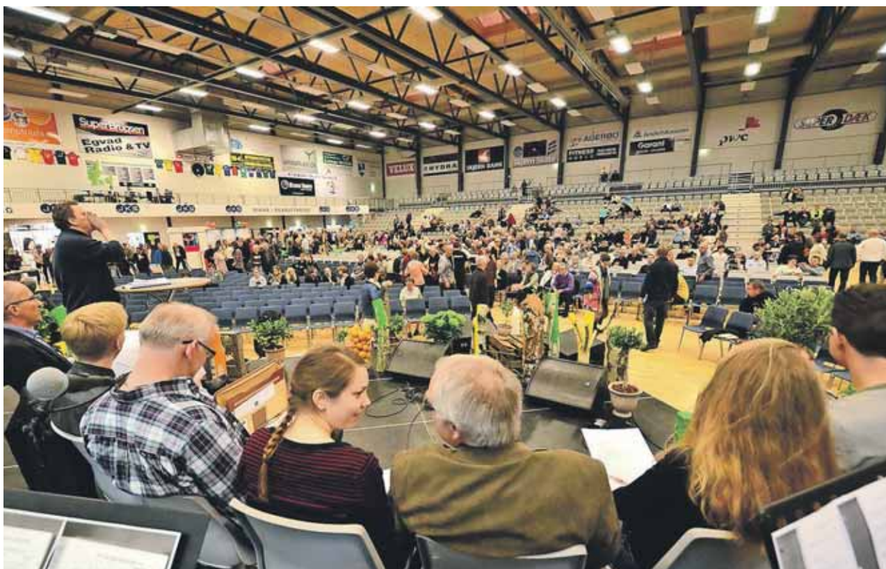
Ved LM's Landsmøde i 2013 foregik landsmødedrøftelsen som en paneldebat, hvor landsmødedeltagerne kunne stille spørgsmål til repræsentanter for mange arbejdsgrøner ud fra formandens og generalsekretærens foredrag.