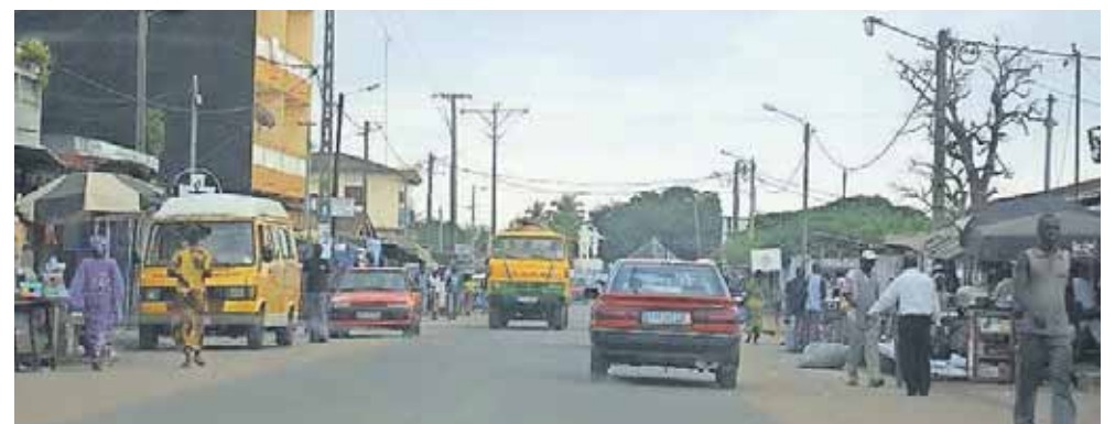
Gadebillede fra Grand-Bassam i Elfenbenskysten.

To strandhoteller i turistbyen Grand-Bassam blev angrebet af svært bevæbnede mænd. Missionærerne befinder sig af og til i området