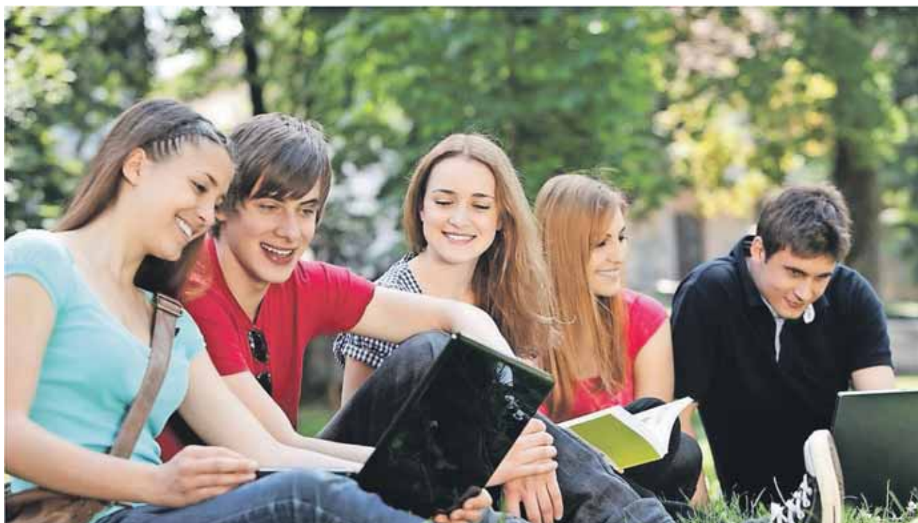
Forpligtende og givende venskaber kan opfylde nogle af menneskers fundamentale følelsesmæssige behov.

Den vej går mellem fordømmelse af homoseksuelle på den ene side og