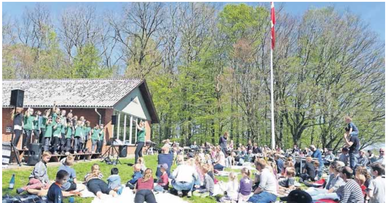
Der var festlig korsang, da lejrstedet Solbakken Kristi Himmelfartsdag i år holdt Børne- og juniorstævne under åben himmel.

LM's lejrsted Solbakken i Sønderjylland har jubilæum den 17. juni. Stedet har i årenes løb dannet rammen om mange børns møde med Jesus