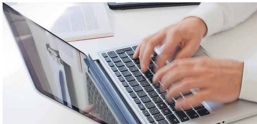
Den Frie Bibel findes kun elektronisk, fordi den hele tiden skal kunne justeres.

"Hele Bibelen peger på Kristus. Det kendetegner den lutherske bibeloversættelse og skal også være inspiration for vores projekt."