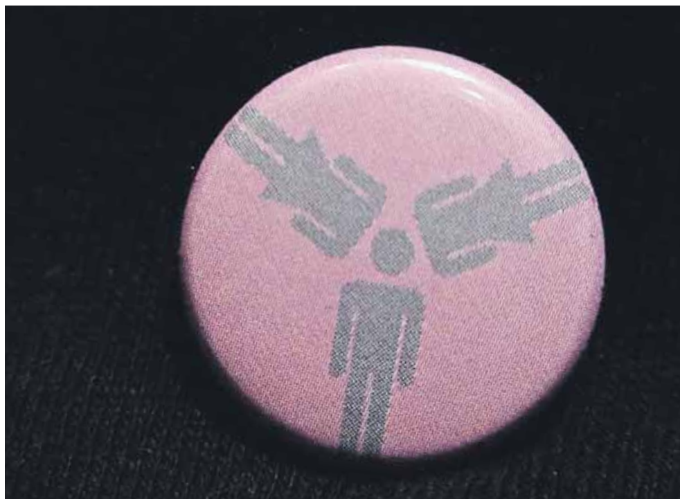
Ida har skiftevis følt sig tiltrukket af både mænd og kvinder. Efter hun er blevet kristen, ønsker hun at finde en mand, hun kan opbygge et godt ægteskab med.

"Det er en kamp indimellem, men jeg ønsker at leve