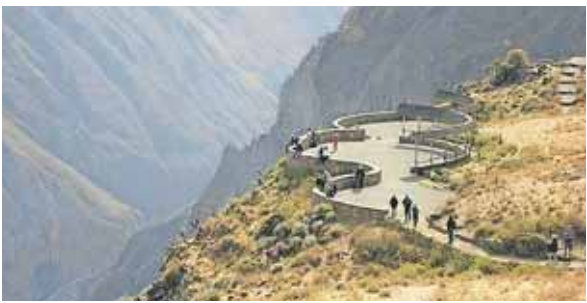
Jordskælvet ramte Colcadalen nord for Arequipa.

"Der er mange, der har mistet en af deres kære i uroilighederne. Det bedste, vi kan gøre lige nu, er at bede for fred i landet og Guds indgriben. Og bed også gerne for, at vi må være trygge – at Gud vil passe på os," lyder det fra LM's udsendte i landet. kbr