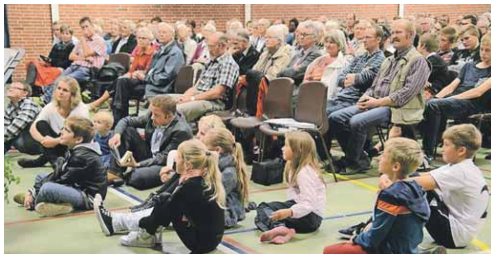
I nogle områder i landet står afdelingsledet stærkt – her er der fællesmøde i Vestjylland.

"Da frimenighederne kom, ville man have lokale ældste-