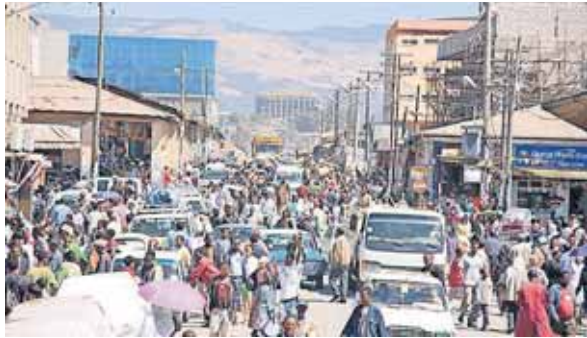
Uroilighederne i Addis Abeba skyldes politisk utilfredshed.

HENRIK KRISTENSEN ► Menigheden i Puno er en missionerende kirke. De er ikke så bange for at ville være flere