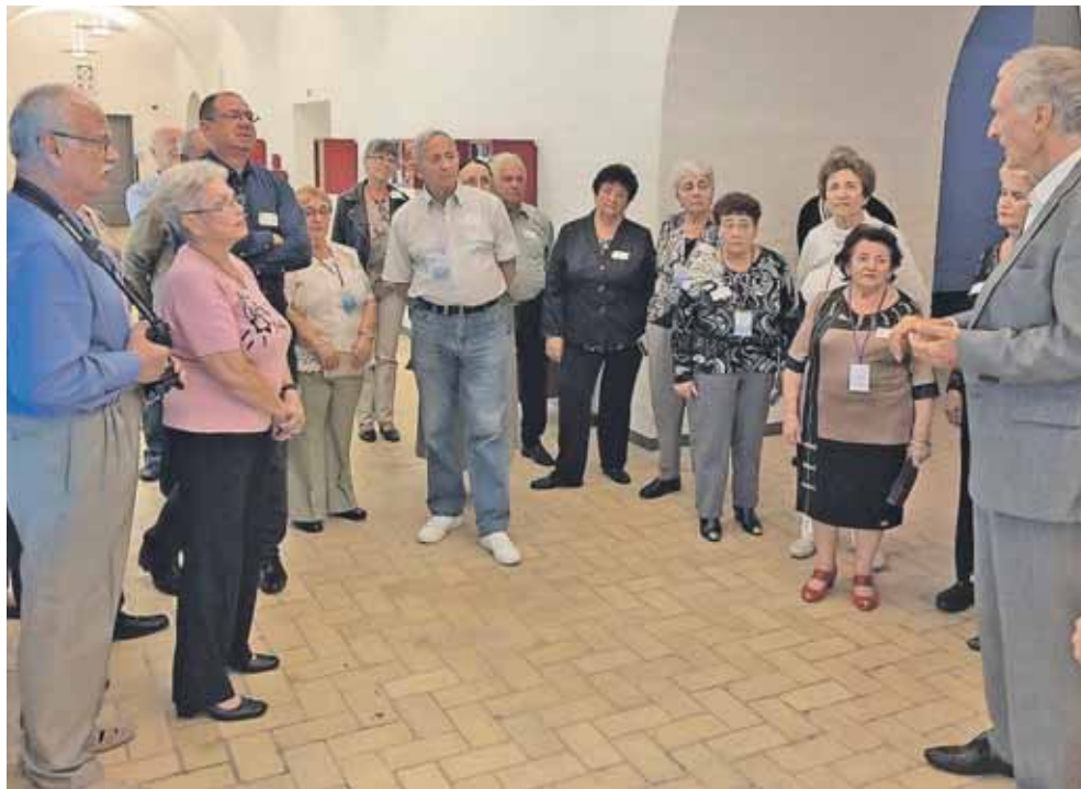
Under deres besøg i Danmark var gruppen af jødiske Holocaust-overlevende i København og se Folketinget, hvor kultur- og kirkeminister Bertel Haarder viste de israelske gæster rundt.

Man kan komme langt med kropssprog, tegn og "hertesprog". Der er ingen tvivl om, at besøget af de danske seniorer og den gæstfrihed og varme, de