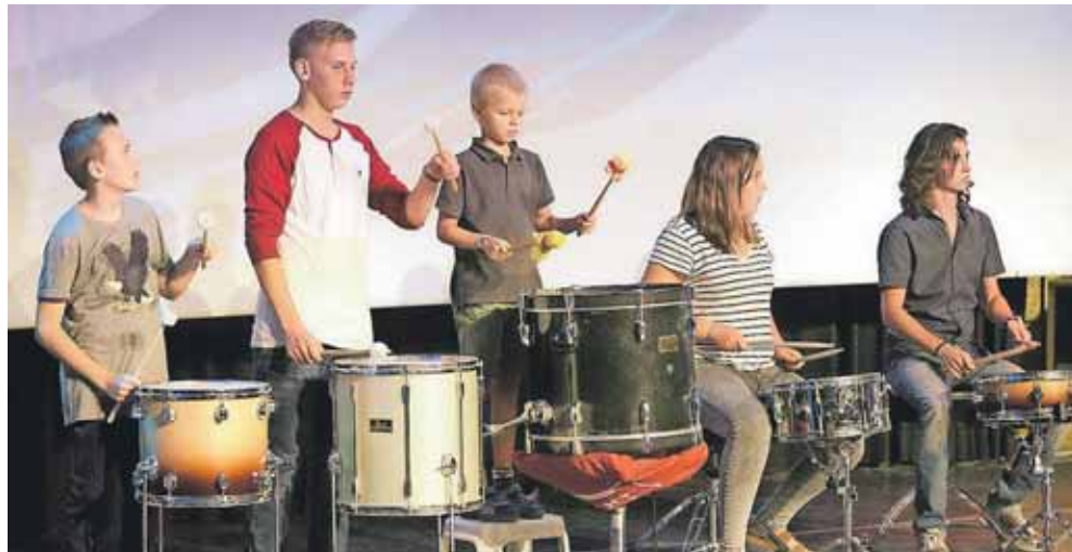
Musikundervisning fylder meget på Yuval for at udruste til at lovsynge og tilbede Gud.

Både jøder og arabere Yuval er en messiansk organisation, men undervisningen er åben for alle. Hvis det drejer sig om børn, skal forældrene blot skrive under på, at de er klar over, at det