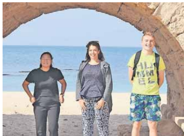
Dansk Jødisk Venskab havde i efteråret tre volontører i Israel.