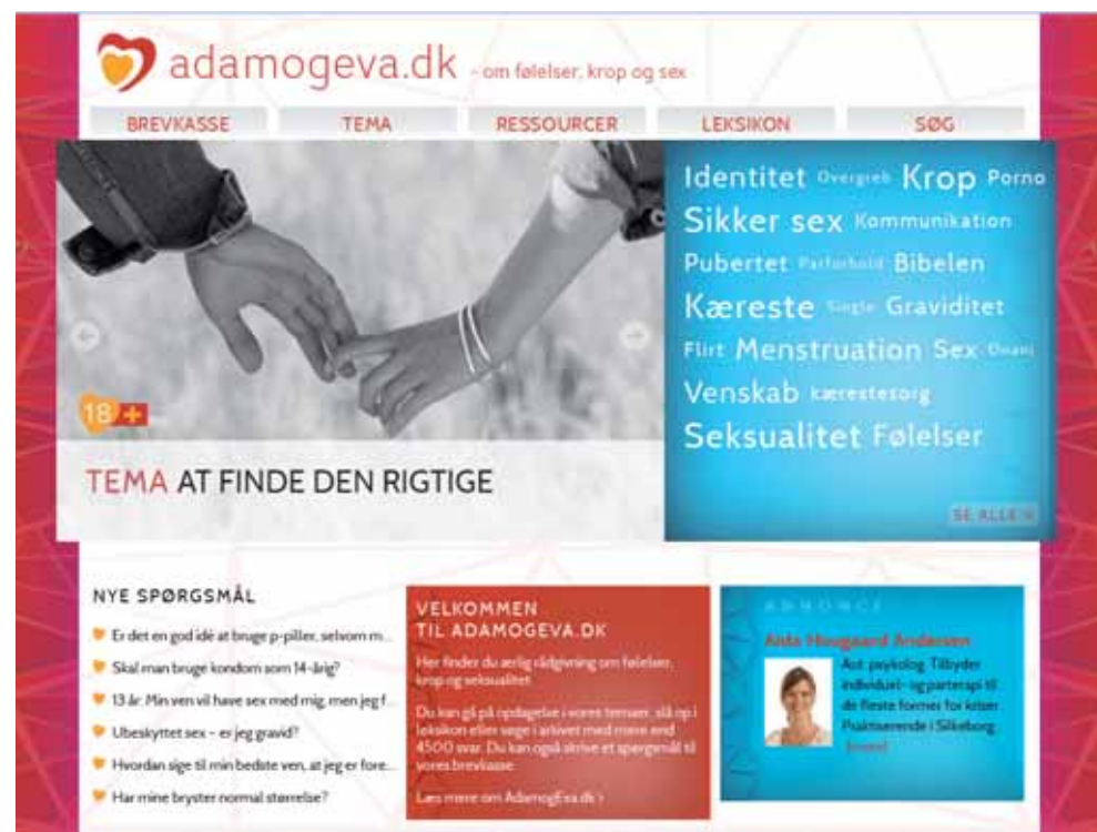
Der har hele tiden været tre grundelementer på adamogeva.dk: brevkasse, artikler og et leksikon.

Adamogeva.dk er kendt og brugt af rigtig mange men-