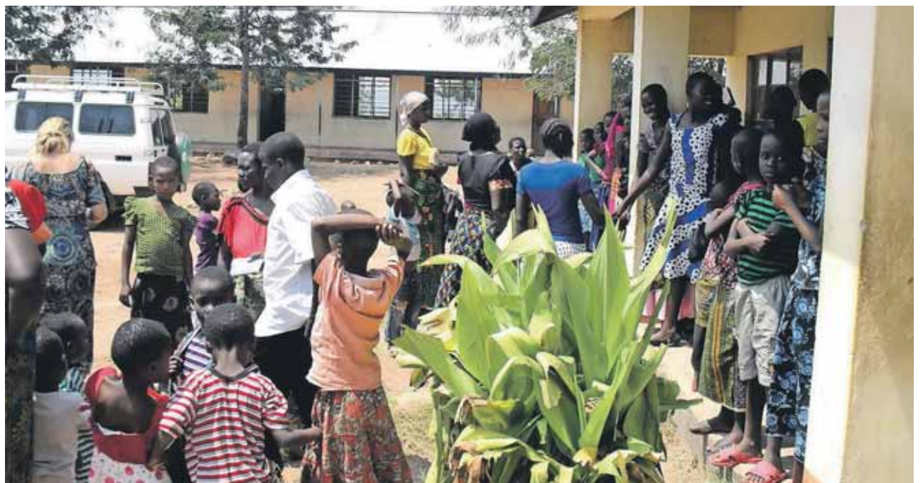
I Masurura holder de gudstjenester i et klasselokale. Her ses en del af menigheden udenfor.

I Mara i Tanzania er et ja til Jesus nok mere et ønske om fortsat kontakt til kirken end en bekendelse