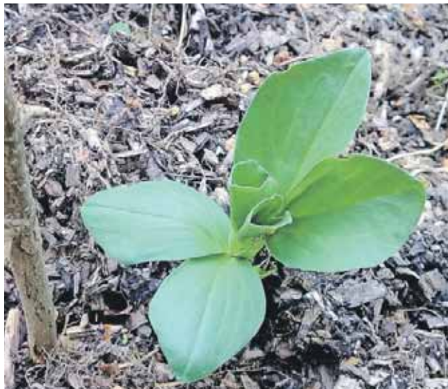
Jesu sammenligner sig selv med et frø, der må lægges i jorden og dø for at kunne give liv.

Vi fascineres af denne verdens herlighed, beundrer denne verdens dygtige