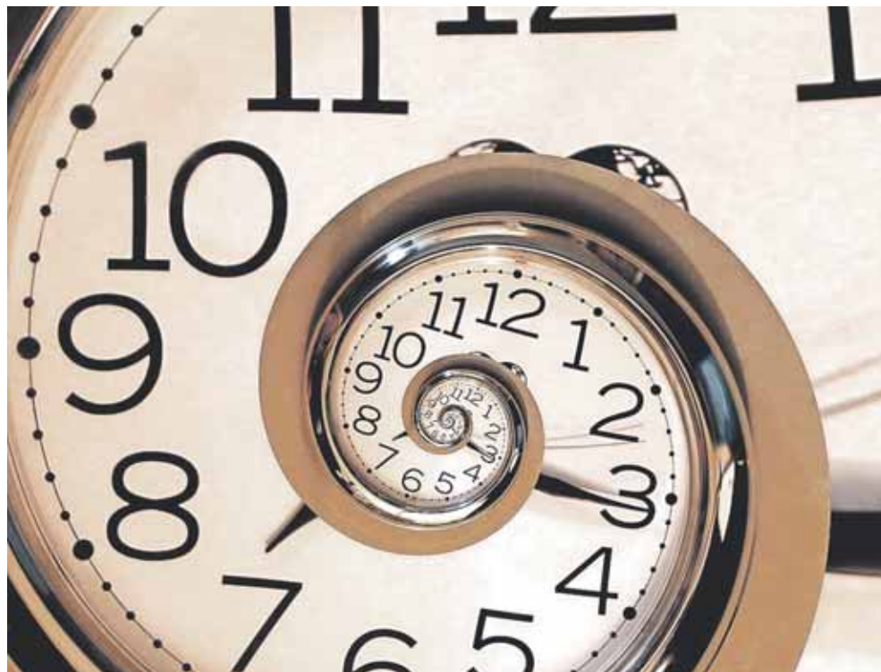
Som single kan man planlægge min tid uden at skulle tage hensyn til familie, siger Ejler Nørager.

"Som single kan man bruge min tid, som man vil uden at skulle tage hensyn til børn og ægtefælle," for-