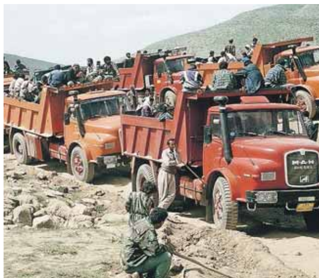
Kurdiske flygtninge på vej ind i Tyrkiet.

"Det er min opfattelse, at vi får beskyttelsen af religiøse minoriteter ind i strategien," sagde han ifølge Kristeligt Dagblad .