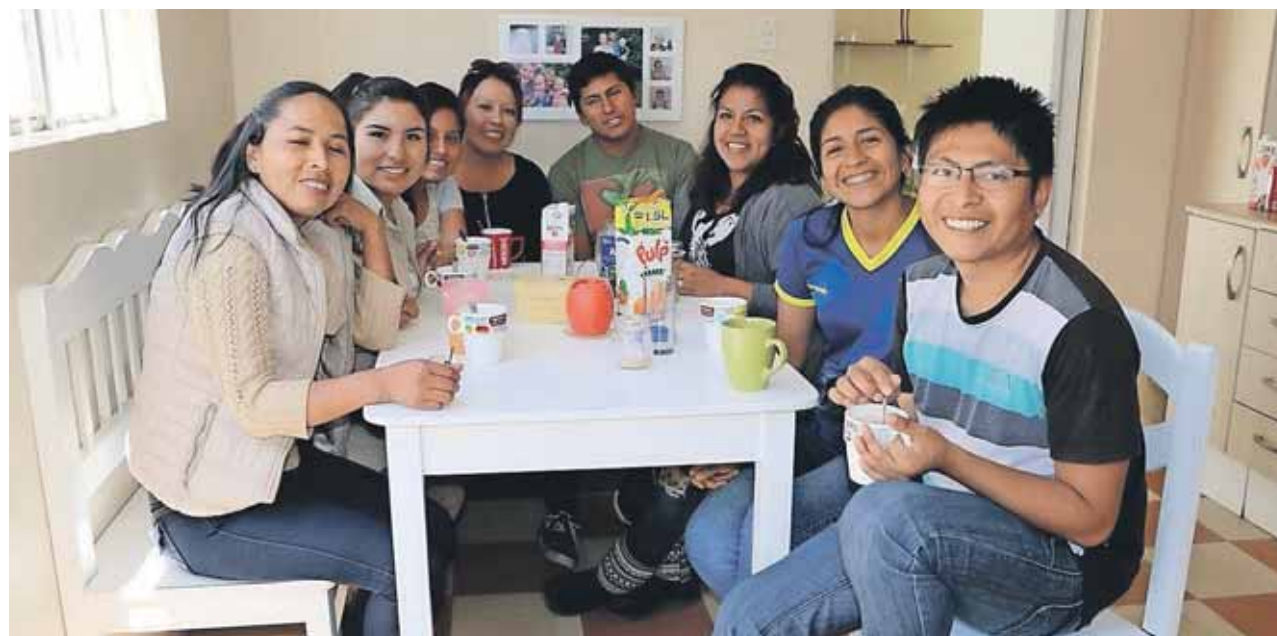
De unge på bibelskolen i Arequipa bor sammen og fungerer på mange måder som en familie i de ni måneder, opholdet varer.