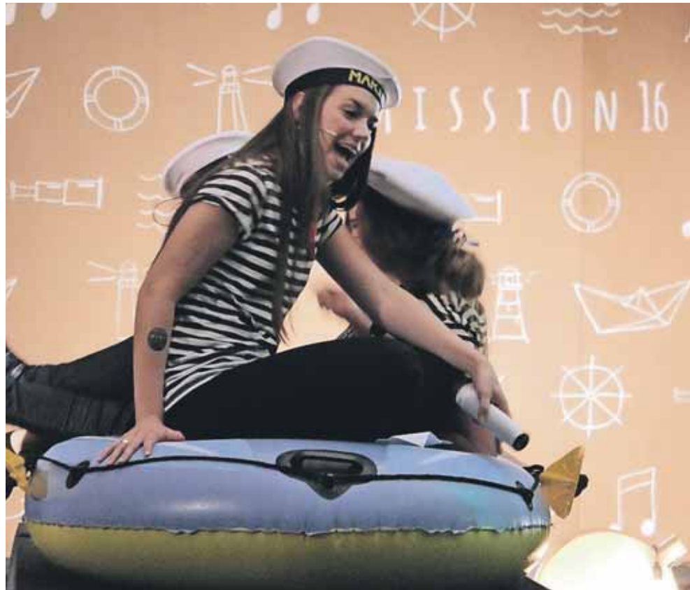
Et dramastykke med to piger i en redningsgummibåd var optakt til prædikenen lørdag aften.