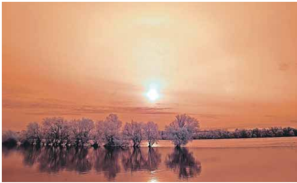
Ved Jesu genkomst bryder Morgenstjernen, Kristus selv, frem, og mørkets tid er forbi.

På bjergene fandt et enestående møde sted mellem på den ene side Moses og Elias som repræsentanter for den gamle pagt og på den anden side Jesus som opfyldelsen af den gamle pagt i den nye pagt. Det pro-