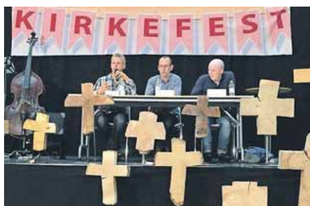
Evangelisk Luthersk Netværk blev oprettet i 2006 og holdt stor tiårs fødselsdagsfest i Skjern i 2016.

I LM siges trosbekendelsen i dag stort set kun højt i frimenighederne. Sandsynligvis som en inspiration fra folkekirken.