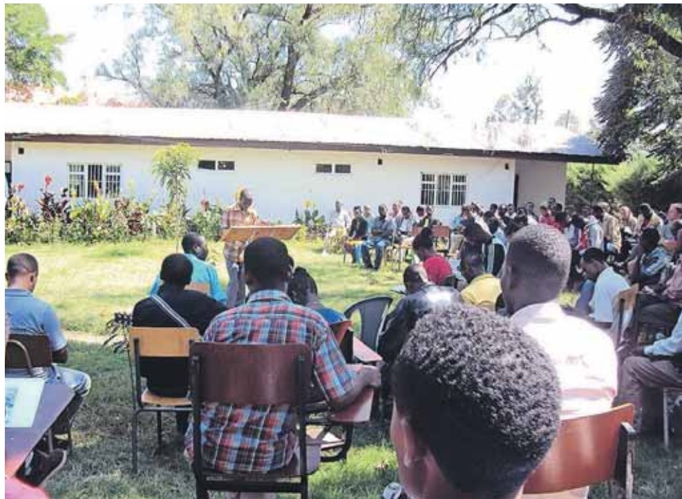
Den etiopiske Mekane Yesus Kirken er selv blevet bevidst om at arbejde med mission. Derfor udfaser LM i landet. Her er der andagt på missions- og bibelskolen Tabor i Hawassa.

Vi vil gerne være fleksible og mobile i missionsarbejdet og være på omgangshøjde med den generelle verdensmission. Udviklingen går stærkt i mange af missionslandene, og derfor kan behovene og arbejdsformerne skifte. Desuden går det globale missionsarbejde på kryds og tværs af lande, folkegrupper og kulturer på