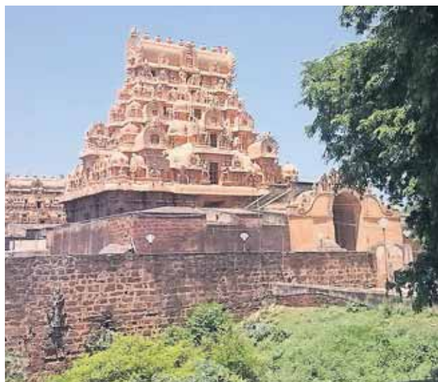
Hindutemplet Brihadeeswara i den indiske delstat Tamil Nadu.

Angreb involverer både fysiske overgreb på børn og voksne samt angreb på kirkebygninger