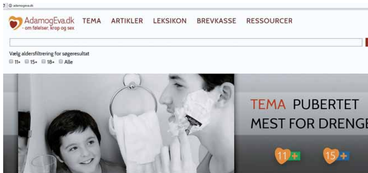
Hjemmesiden AdamogEva.dk er populær blandt de 11-25-årige. Både kristne, ikke-kristne og muslimske unge besøger siden.

desværre, at der er alt for mange unge, der ikke kan snakke med deres forældre eller andre voksne om deres seksualitet. Nogle gange kan det være en fordom hos de unge selv: 'Åh nej, hvad mon de tænker om mig, hvis jeg fortæller det her?', som holder dem tilbage."