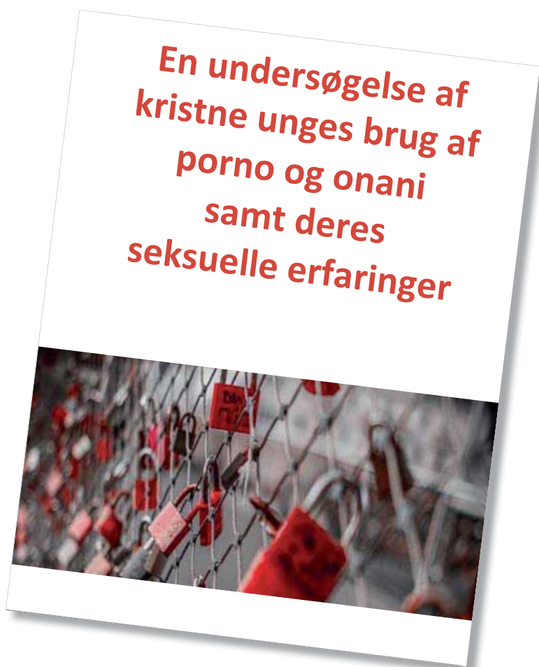
Porno er ikke kun et mandeproblem. AdamogEva.dk's undersøgelsen i 2016 viste, at hver tiende pige og kvinde ser porno mindst én gang om måneden.

Porno er nemmere at få adgang til i dag end nogensinde før, da mange let kan gå på nettet via deres telefon.