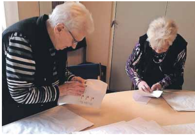
De ældre i Videbæk arbejder koncentreret på at pakke Komfrit.