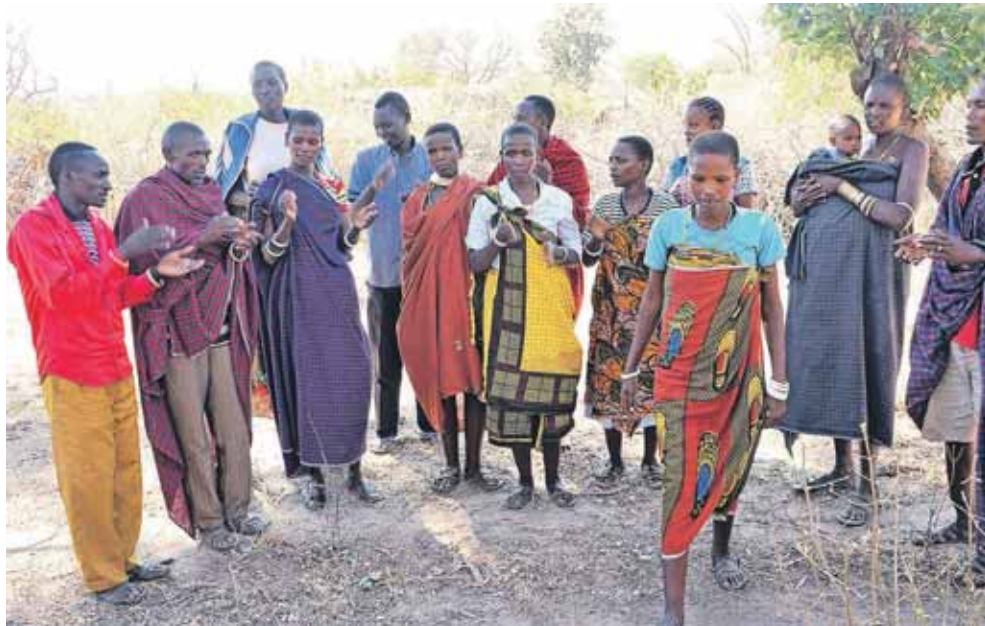
Et kor af nyfrelste barabaiger i en landsby i det sydlige Tanzania synger til Guds ære.

Tidligere var nomademissionen målrettet masalierne, som er mere åbne over for det omkringliggende sam-