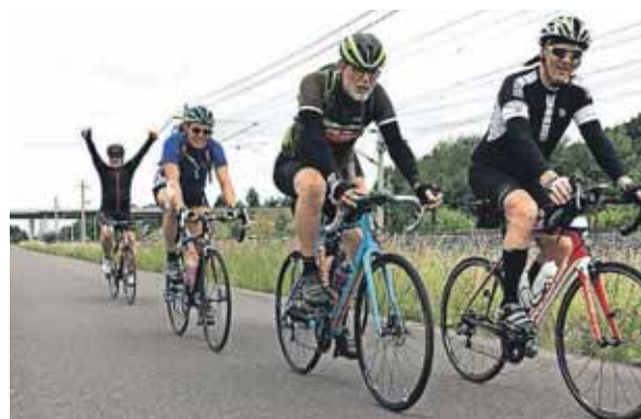
Det hårdtarbejdende cykelhold har klaret endnu en stigning på vejen fra Løgumkloster til Wittenberg.