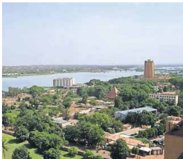
Malls hovedstad Bamako.

NLM tør ikke længere have børnefamilier udstationeret i det urolige vestafrikanske land