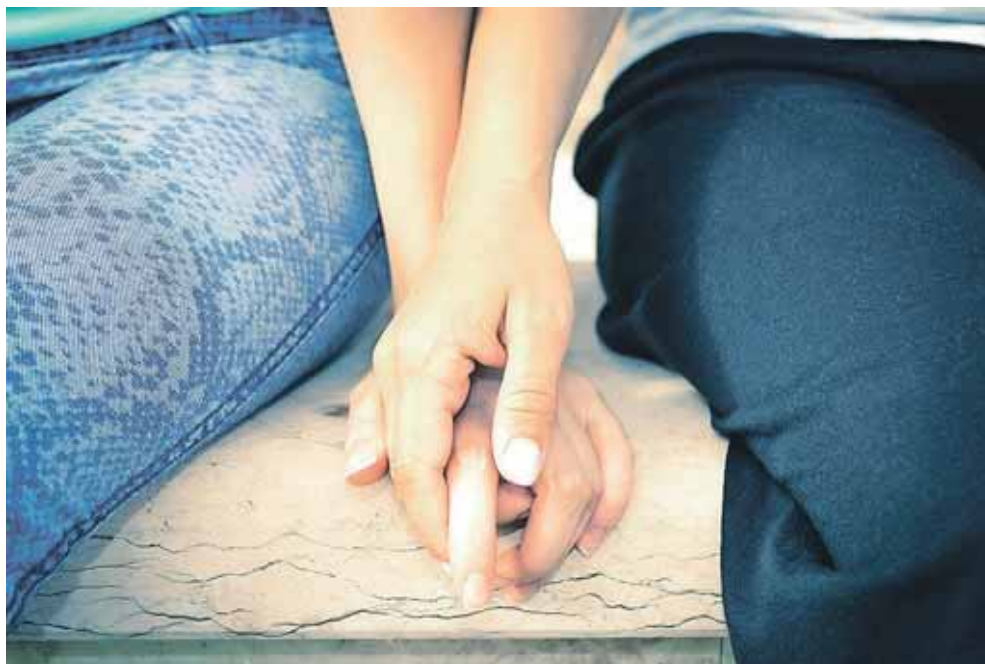
Virksomheder i USA uden en fysisk butik må gerne sige nej til at betjene samkønnede bryllupper.