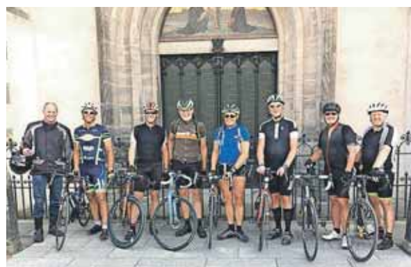
Glæden var stor over endelig at nå målet, som var kirkeporten i Wittenberg, hvor Martin Luther opslugte sine teser.