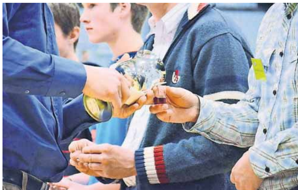
Guds ord, dåben og nadveren rummer en kraft i sig til at virke på mennesker. Denne kraft kommer ikke fra det menneske, der forkynder evangeliet eller rækker sakramenterne.

Jesus har givet den troende menighed den opgave at