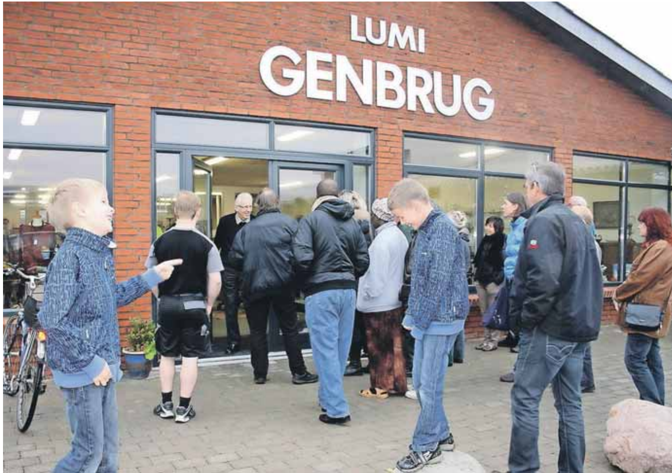
Ikke mindst i forbindelse med LUMI Genbrug har LM fået større kontakt med frivillige, som ikke identificerer sig med LM.

På den positive side kan det være et udtryk for eller være med til at udvikle et mere bevidst lægfolk. Det stiller også dog større krav