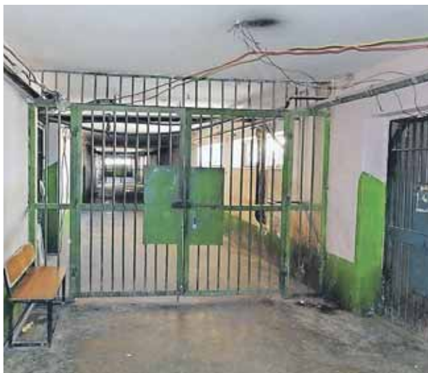
Pul-i-Charki fængslet, der ligger øst for Kabul i Afghanistan.

De svenske immigrationsmyndigheder sender kristne flygtninge i verdens værste fængsler, siger advokat