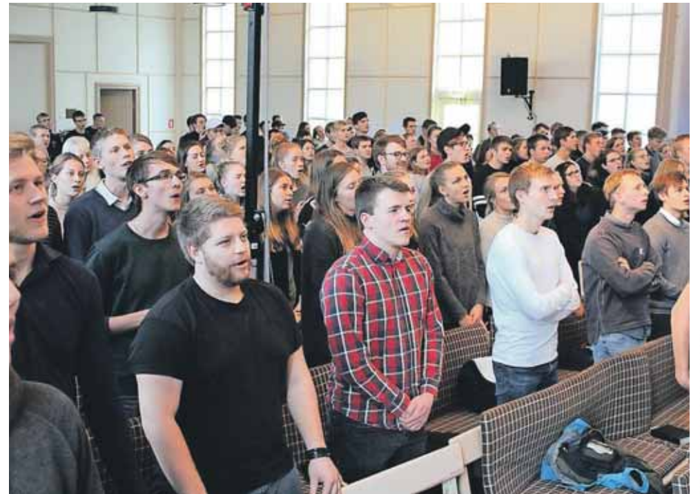
Omkring 350 unge havde fokus på mission den 17.-19. november på LMU's højskole i Hillerød.

Det gjorde, at der i alt blev tegnet 42 fastgiver-aftaler. Nogle er helt nye faste givere, mens andre har forhøjet deres beløb på en allerede