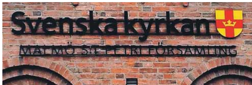
Svenska Kyrkans har vedtaget en ny liturgi-bog med mulighed for at omtale Gud kønsneutral.

Men den nye liturgi omtaler også synd som noget, der heles fremfor tilgives og forsones. Den nye sprogbrug har mødt kritik fra en gruppe medlemmer