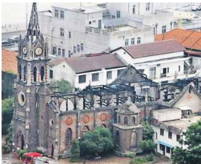
En af de kirker i Zhejiang-provinsen i det østlige Kina, hvor myndighederne har fjernet kors.

Kinesiske kristne får ikke offentlig støtte, hvis de har kors eller billeder af Jesus i deres stue