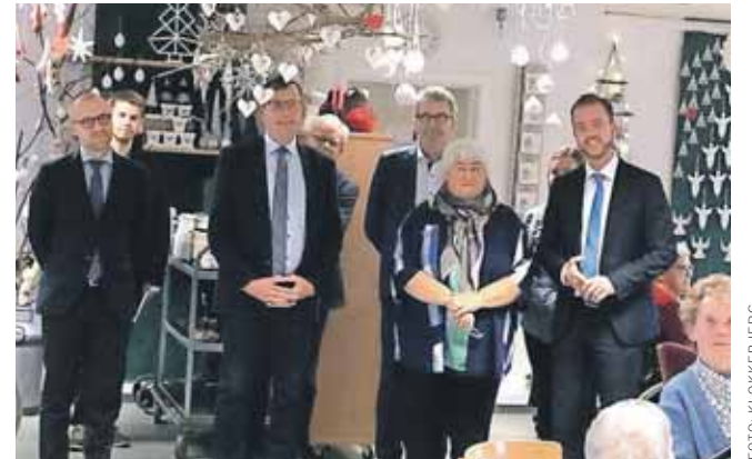
Ministrene (til højre) tilbragte eftermiddagen på Klokkebjerg.

"Til det formål er Klokkebjerg opdelt i fem enheder