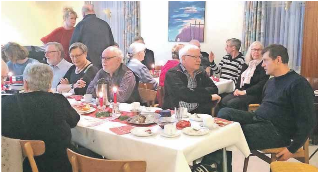
Snakken gik lystigt ved kaffebordene til adventsfesten i Mørkøv LM.

Det er 1. søndag i advent, og missionshuset i Mørkøv holder adventsfest. Der sidder