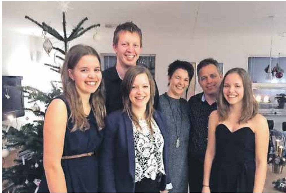
Familien Mouridsen vil gerne dele deres familie-julehygge med andre.

Efter familien for et par år siden fik lagt deres virksomhedsstruktur om, har de kunnet holde lukket i julen.