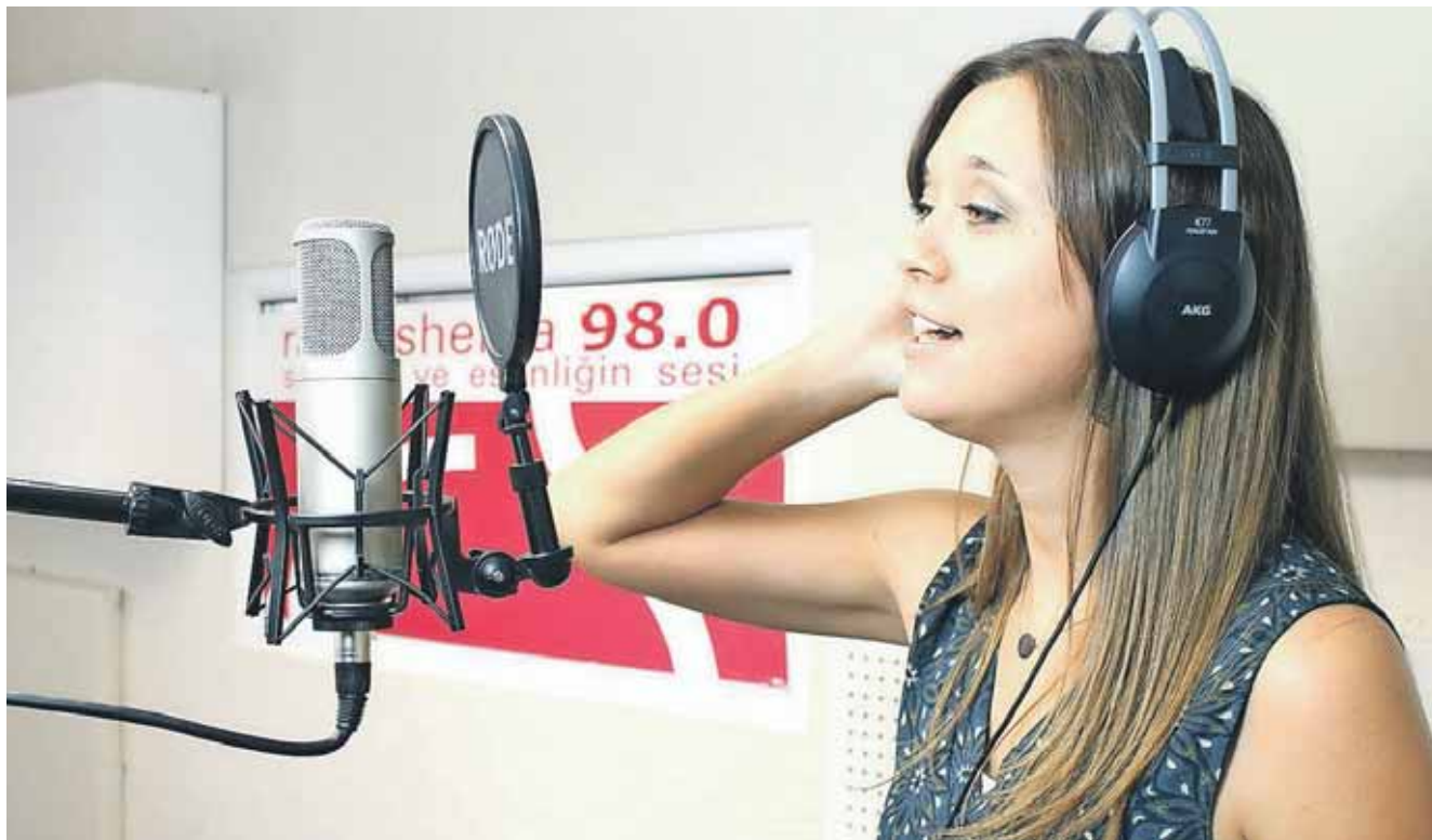
De fleste af Radio Shemas programmer bliver produceret i Ankara og sendt ud til de øvrige radiostationer. Radio Shemas udsendelser kan høres af 15 procent af Tyrkiets befolkning.

Gennem medierne – internetradio, YouTube, Scope (Periscope) og andre sociale medier – kan man nå utrolig mange mennesker på én