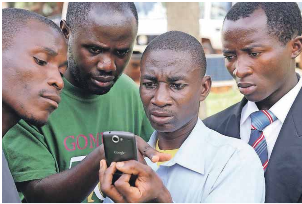
Soma Biblia har svært ved at nå den unge generation i Tanzania med traditionelle bøger. Men mange har en smartphone og kan måske nås gennem de sociale medier.

Når Soma Biblia tænker i andre baner end bøger og hæfter, som de traditionelt er kendt for, skyldes det ikke, at salget går dårligt. Tværtimod, understreger direktøren.