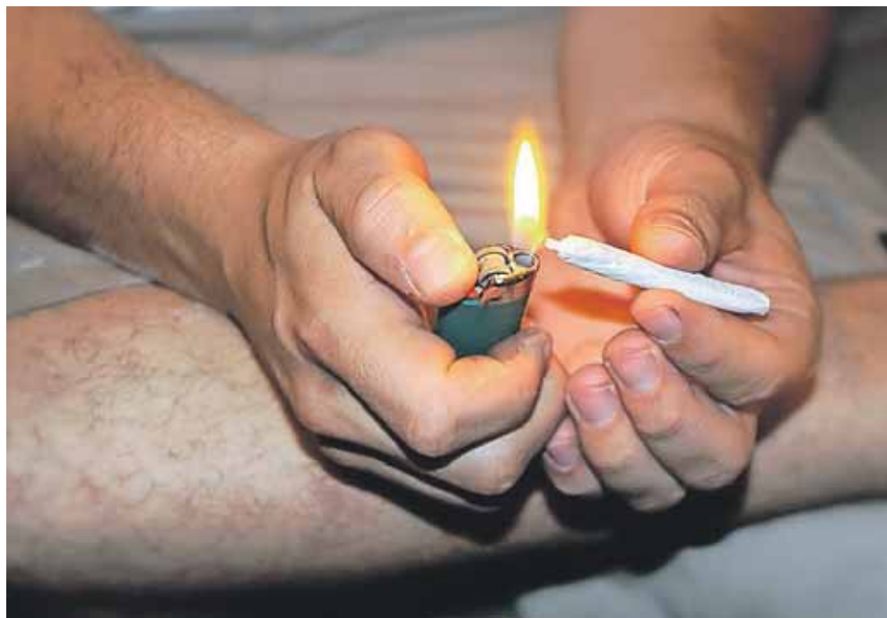
25.000 danske unge under 25 år bruger dagligt hash.

Cirka 17.000 unge under 25 år bruger stort set dagligt hash i Danmark, så da Ungehusets arbejde blandt netop denne gruppe blev vist på landsdækkende tv,