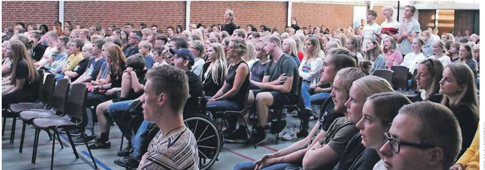
350 unge deltog i Westside Praise på Efterskolen Solgården den 4. september.

en prædikant fra en lokal LM-sammenhæng, men det er også af og til en fra LMH.