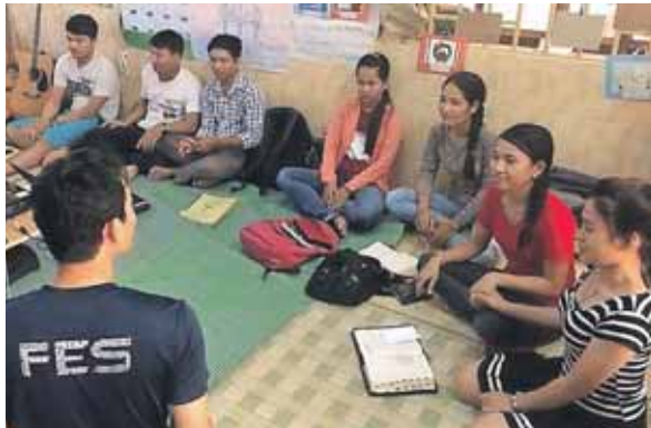
En gruppe studerende i Phnom Penh til bibelstudium.