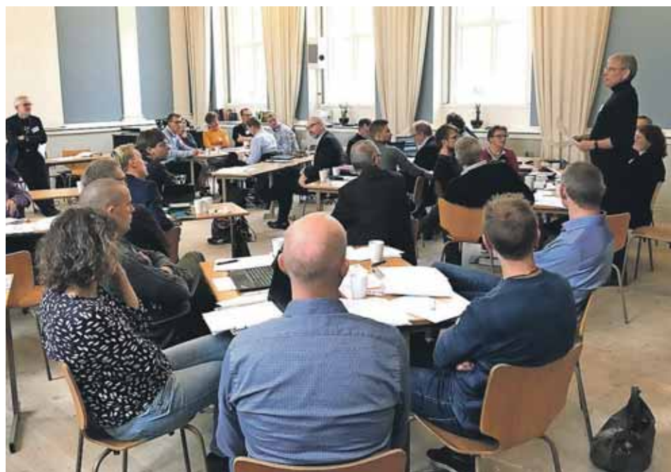
Ved generalforsamlingen blev deltagerne delt ind i seks grupper, der hver skulle drømt om hvilke tiltag, de så for sig i LM-regi i Danmark samt, hvordan de kunne konkretiseres.