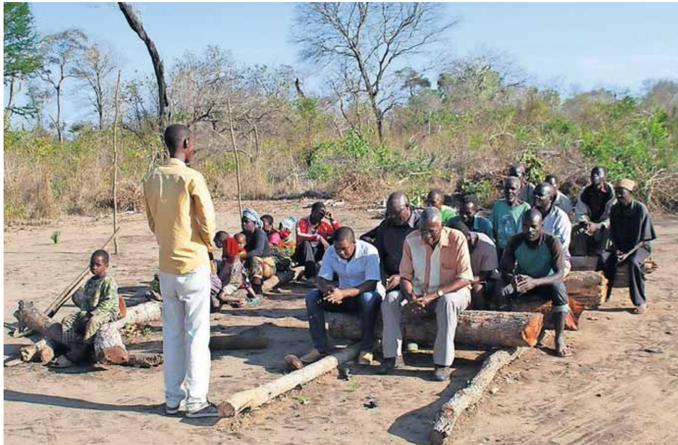
Kirken i Nyakipande består af fire fældede træer i en rydning i skoven. Men de er ved at gøre klar til at bygge en kirke af mursten.

der siden 2012 har missioneret i byen, åbnede sit hjem på to evangelisationsture for gruppen på 30 mand fra Dar es Salaam. Med sig i bilen havde de lægeudstyr, bibler og en projektor, så der kunne vises Jesus-film om aftenen.