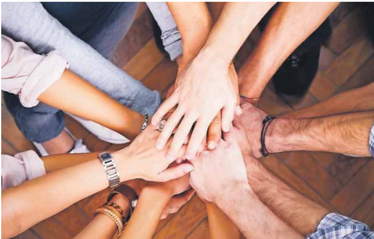
På Landsgeneralforsamlingen drøftede man, hvad sammenhængskraften i LM består af, og hvordan den kan styrkes.

En anden repræsentant fra LMBU ønskede sig, at det blev tydeligere, hvad man skal bruge afdelingerne