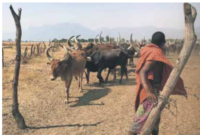
Sukuma-stammen tæller omkring 8,9 millioner mennesker og er den største etniske gruppe i Tanzania (Kilde: Wikipedia).

Han forklarer, at tre af eleverne fra området er fra sukuma-stammen, og resten er fiskere ved Rukwasøen.