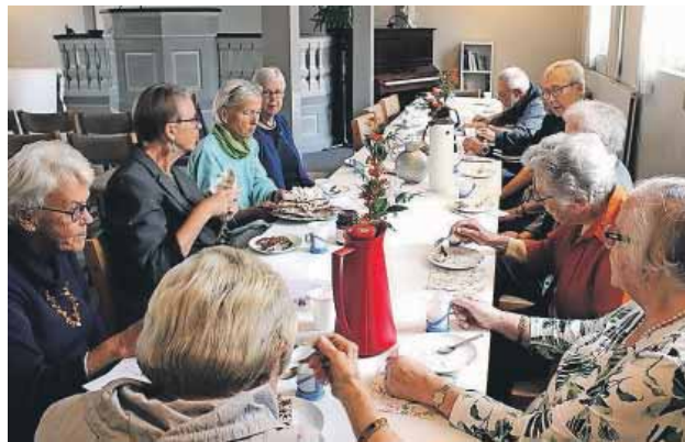
Der skal være god tid til snak, hygge, kaffe og kage i Café Klippen.