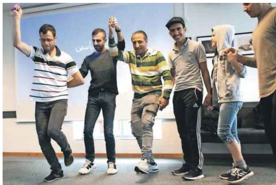
En gruppe kurdiske flygtninge underviste eleverne på LME i kurdisk dans.

En af eleverne, som var med til at danse i dagligstuen, fornemmede en god stemning blandt både børn og voksne, som nød at danse med eleverne. Et barn fortalte, at hun elsker hiphop, men hun fortalte også, at hun ikke har mulighed for at danse på grund af den situation, hun er i. Derfor nyder hun at komme væk og danse med andre.