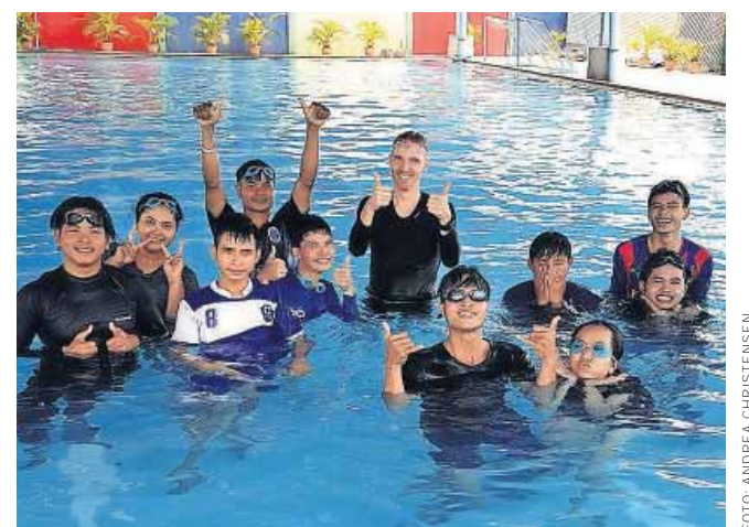
26 studerende fra Phnom Penh deltog i kristen svømmelejr.

"Seks af deltagerne på svømmelejren hørte evangeliet for første gang i deres liv. Og vi håber, at de vil komme igen i SONOKO, så de kan høre mere om Jesus."