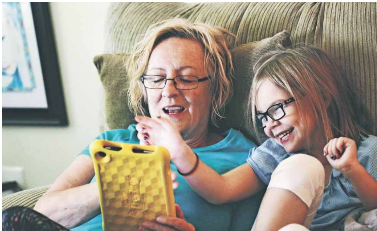
I " Hæng ud med Gud " er der både samtalspørgsmål, man kan tale om i familien, og noget, de voksne kan reflektere over

Materialet er markedsført meget bredt Prøvapakken er blevet markedsført gennem forskellige typer Facebook-opslag målrettet forskellige grupper. Det har givet respons, forklarer Bibel-læser-Ringens