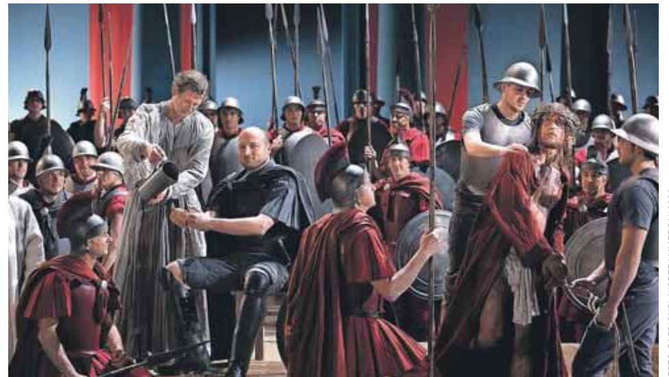
Scenen, hvor Pilatus dømmer Jesus til døden, fra et tidligere passionsspil i Oberammergau.