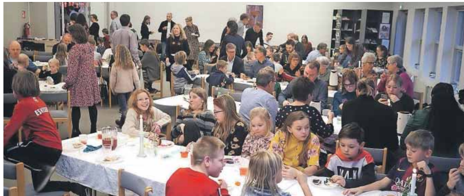
Salen var fuld af både børn og voksne, da Kirken ved Søerne fejrede sit tiårs-jubilæum.