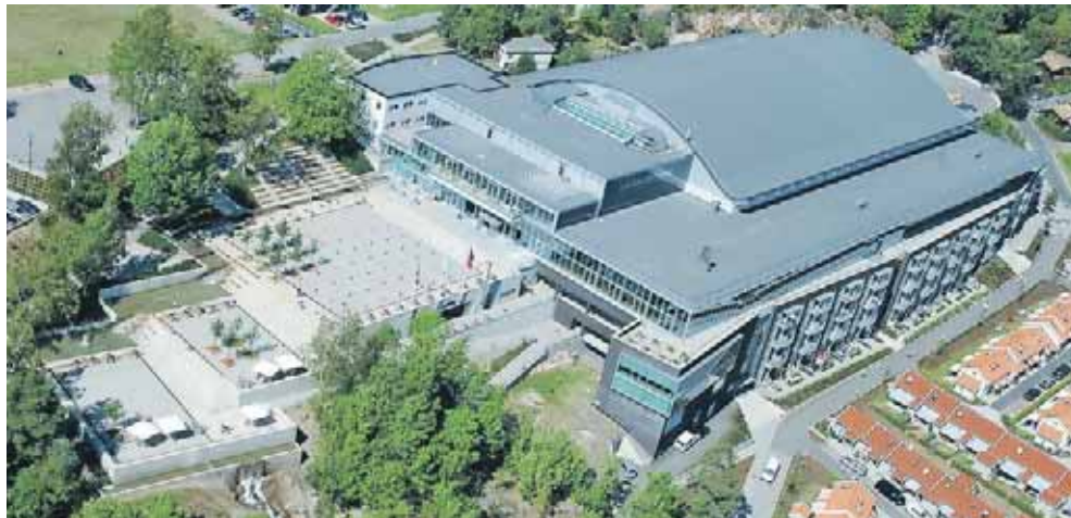
Oslofjord Arena er en del af Oslofjord Convention Center. Det ejes af Brunstadstiftelsen, der er oprettet af Brunstad Christian Church.