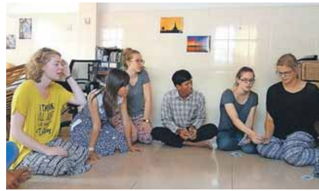
Tidligere LM-volontører i Cambodja spiller kort med lokale unge.

"Volontørerne er de små tandhjul, der får uret til at gå. Hvis de mangler, går uret