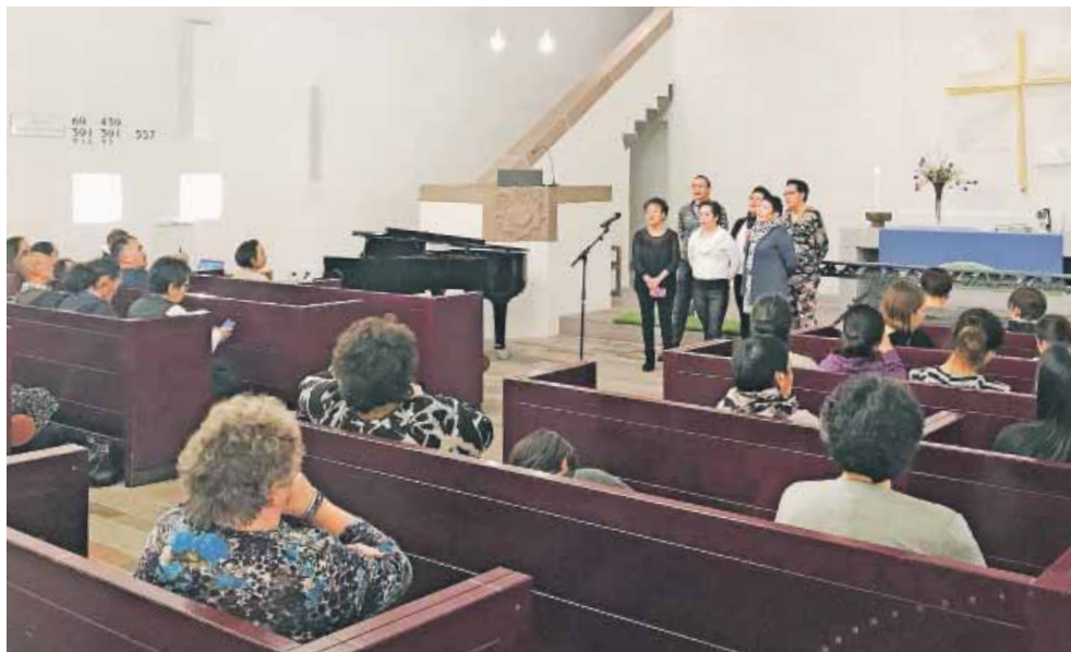
Et lokalt grønlandsk kor medvirkede ved gudstjeneste i Kvaglund Kirke.

Arbejder tæt sammen med grønlanderforening Gudstjenesten var den første af seks gudstjenester, som de to evangelister har planlagt i løbet af foråret