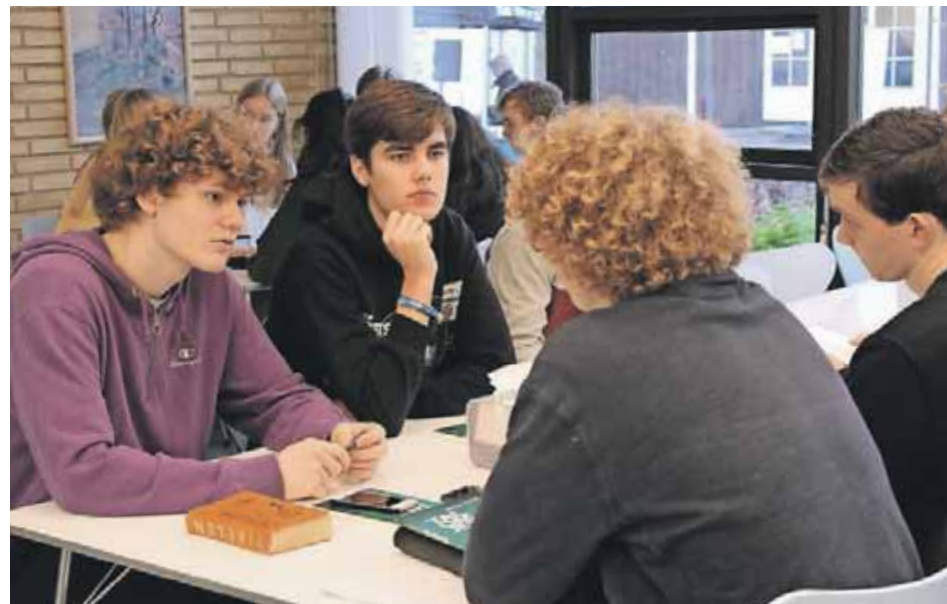
Bibelstudium er hovedelementet i "Udforsk livet", for det er dér, man møder Jesus.