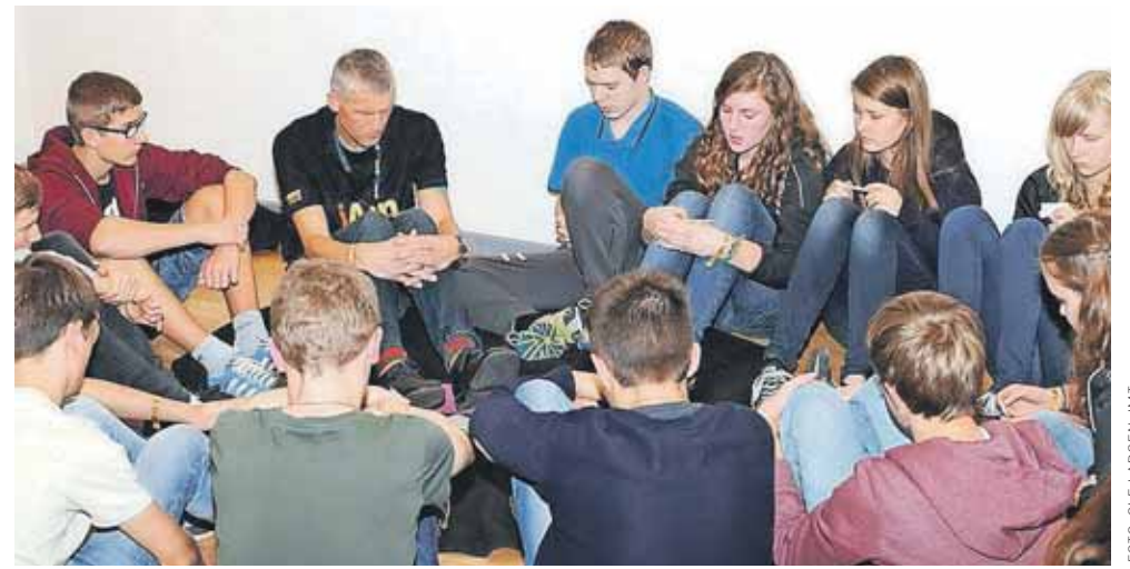
Fællesbøn i en smågruppe på lejren Event i 2013.