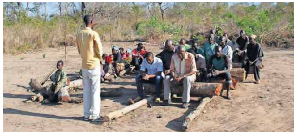
Besøgene i Nyakipande af Soma Biblia og evangelistteamet fra New Life in Christ har resulteret i en ny menighed. Her er de samlet til en af deres første gudstjenester.