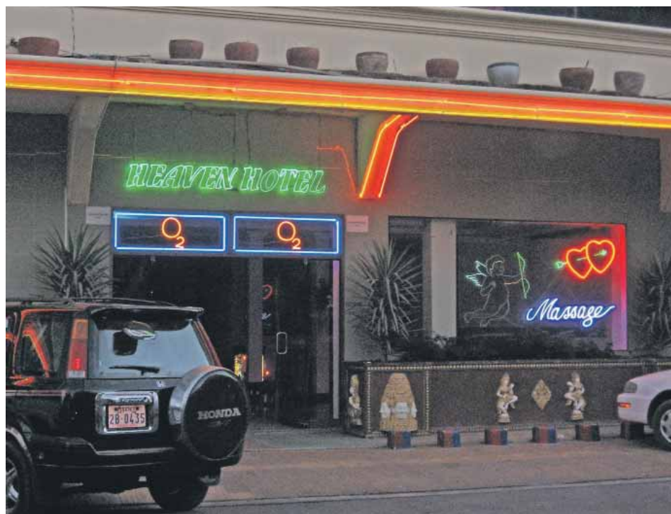
I Phnom Penh er der mange bordeller, hvor unge piger lever under slavelignende forhold.

"Hun blev kristen den første uge, hun var hos os på centeret. Hun ønsker vir-