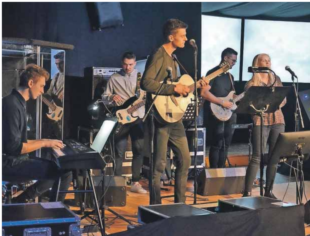
Bandet Hjemvendt har spillet til lovsangen ved flere arrangementer i LM. Her medvirker de ved Mission 19 på LMH.

"Som musiker drømmer man altid om at udgive sin egen musik, og derfor er det