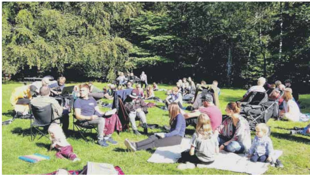
Lørdag eftermiddagen på menighedslejren var der andagt og lovsang i skoven. På gåturen derud hang der sedler i træerne med emner til samtale.

"En weekendlejr er en oplagt chance, men det skal i programmet, for ellers kommer samtalerne meget hurtigt til at handle om fodbold og sommerferie, for det fal-