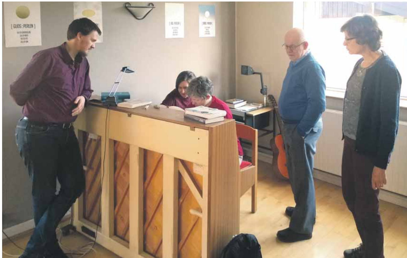
Ved møderne i LM i Rødovre er der hver gang sat plads af til at dele bibelvers, foreslå en sang og stille spørgsmål.