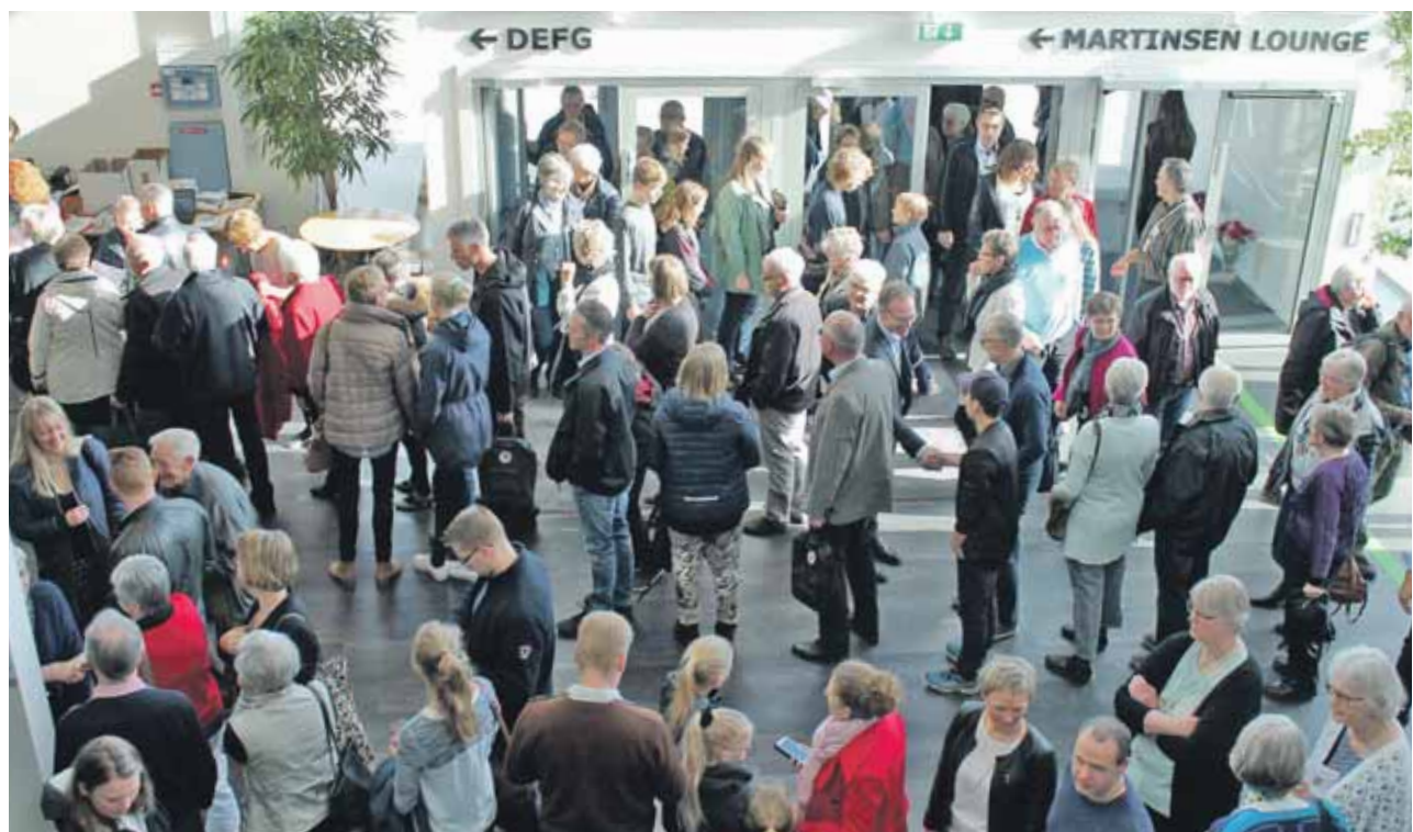
LM's ledelse har aflyst det fysiske landsmøde som her i 2016 og satser i stedet på samle LM'erne om et online landsmøde.

For at skabe lidt af den stemning af fællesskab, som et landsmøde i LM også er, opfordrer LM's ledelse til, at man laver et arrangement lokalt i sin kreds eller frimenighed og sammen tager del i det virtuelle landsmøde.