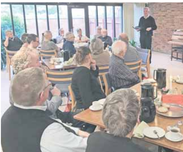
LM's ledelse opfordrer til, at man samles lokalt til landsmøde-fest – som her ved Hedekredsens 25-års jubilæum.

Landsmøde 2021 kan blive det største nogensinde, selv om det bliver påvirket af restriktioner