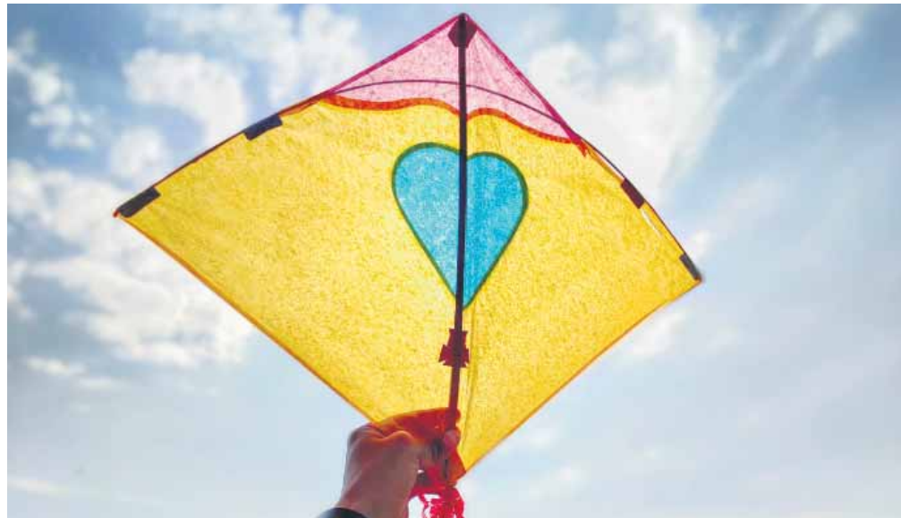
Et af de "hjemmesnedkererede" våben, som den norske radiovært fordømmer Israel for at hævne, er, at palæstinenserne sender brændende drager ind over Israelske marker.

"Vi må bare aldrig glemme, hvor dårlige Israel er. Det er sygt vigtigt, at vi aldrig glemmer det. Vi må aldrig glemme, hvor forfærdelig Israel er."