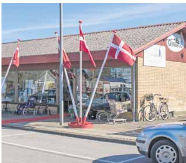
I 2016 fejrede LUMI Genbrug i Agerskov ti års-jubilæum.

I Agerskov holder butikken fast i vagtplaner for at være sammen, rydde op og gøre klar