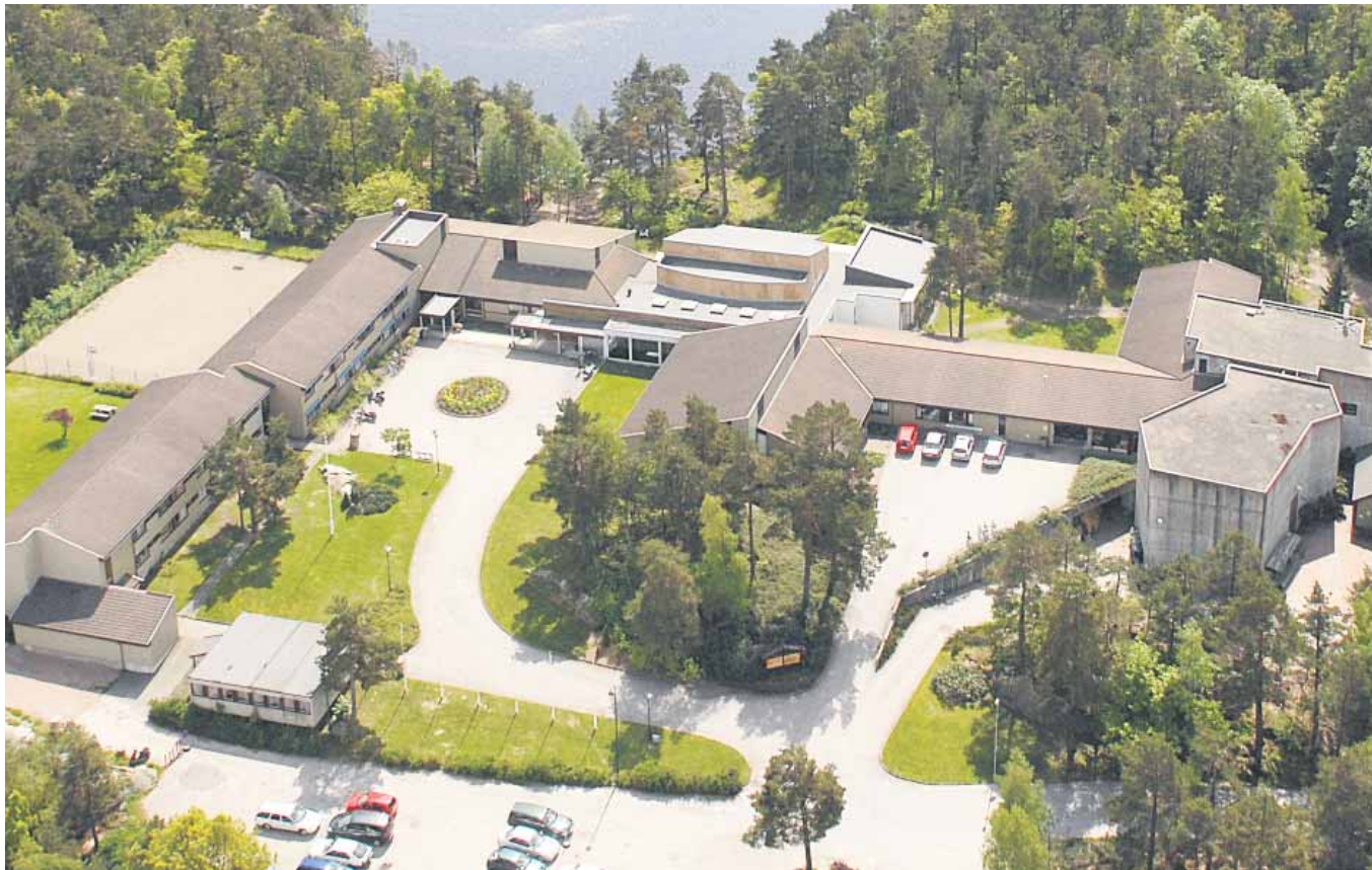
Gimlekollen Medlesenter i Kristiansand, hvor flere LM'ere har studeret, er en del af NLA University College.

Et etisk råd anbefaler de norske myndigheder at undersøge det kristne seminarium NLA på grund af synet på ægteskab