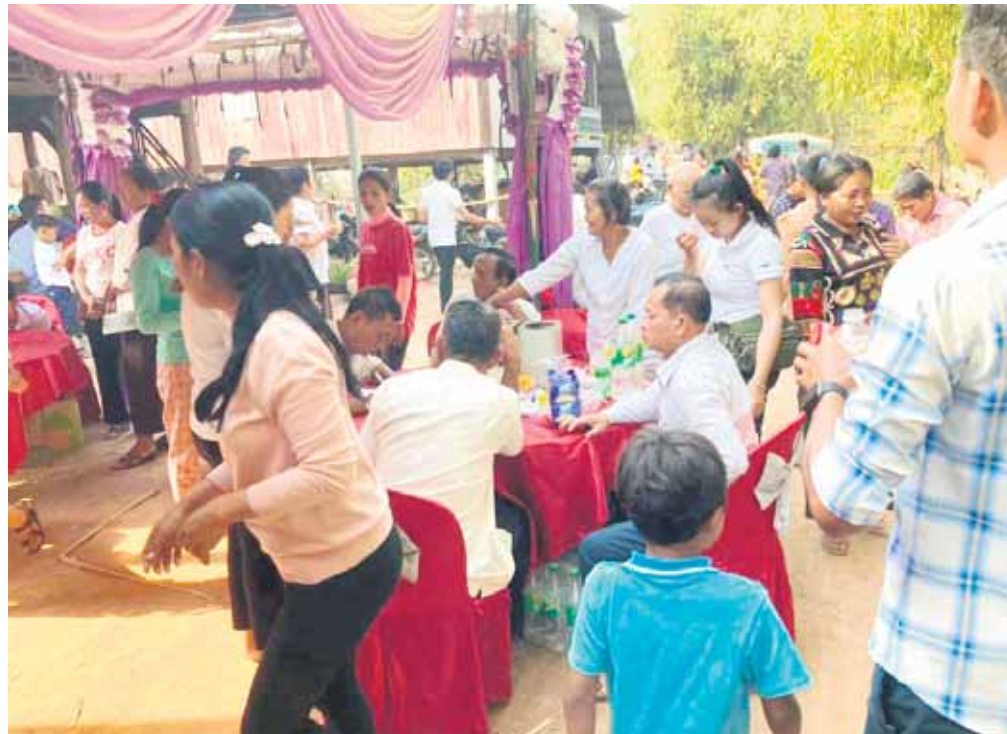
Ved mindefesten for en afdød mødes alle i lokalsamfundet og spiser og beder sammen med det formål, at den afdødes ånd bliver sendt godt videre, fortæller LM's volontører i Siem Reap.

En af de piger, der bor på det kollegium i Siem Reap,