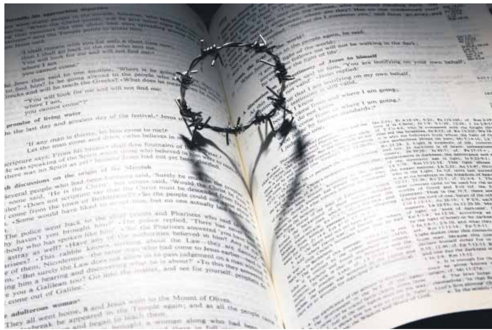
Gud blev forsonet med sig selv, da Jesus bar alverdens synd.

Den ”anden” var Jesus, forklarer missions- og prædikantkonsulenten, der peger på en anden væsentlig forskel på forsoning mellem mennesker og Guds