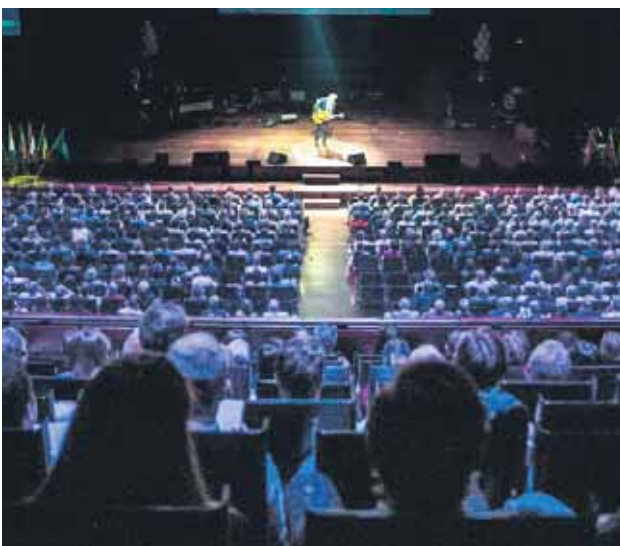
Fra NLM's 125-års jubilæum i 2016.

Hovedstyret arbejder på at skabe plads til kvinder i den centrale ledelse og oprette tilsynsråd på alle niveauer