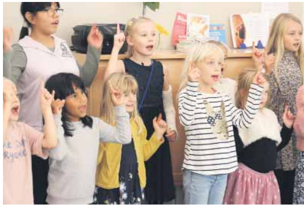
Det nye kor i Silkeborg gav deres første koncert som afslutning på kordagen.

Stort aldersspring er en pædagogisk udfordring Koret, der øver tirsdag efter-